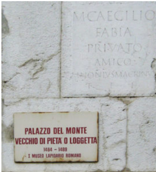
FOTO 1. Particolare del lapidario romano

Colti eruditi del tempo sovrintendono alla disposizione delle vecchie pietre, accostandovi nuove iscrizioni a imitazione di quelle di età romana, per creare un rapporto di emulazione e continuità con l'antica Brixia . Le lapidi sono inserite a vista nella tessitura muraria in pietra di Botticino delle facciate delle Carceri, del Monte Vecchio di Pietà (1489-1491) e del Monte Nuovo di Pietà (1599-1601), a formare un museo pubblico, tra i primi, se non il primo, in Europa.