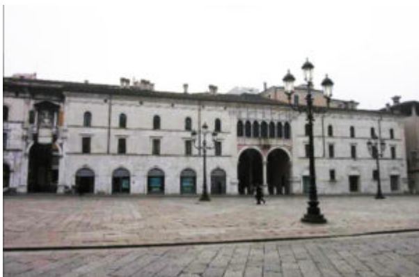
FOTO 2. Monte vecchio di Pietà.

Colti eruditi del tempo sovrintendono alla disposizione delle vecchie pietre, accostandovi nuove iscrizioni a imitazione di quelle di età romana, per creare un rapporto di emulazione e continuità con l'antica Brixia . Le lapidi sono inserite a vista nella tessitura muraria in pietra di Botticino delle facciate delle Carceri, del Monte Vecchio di Pietà (1489-1491) e del Monte Nuovo di Pietà (1599-1601), a formare un museo pubblico, tra i primi, se non il primo, in Europa.