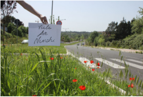
FOTO AVE NINCHI

Nel 2012 due viali del III Municipio sono stati dedicati ad Ave Ninchi e a Elena Fabrizi, più conosciuta come la Sora Lella. Sono state queste le prime intitolazioni deliberate dal Campidoglio e derivate dalle numerose proposte inoltrate dal gruppo di Toponomastica femminile all'Ufficio Toponomastica della capitale. A distanza di quasi quattro anni, ancora i nomi delle due attrici non sono stati inseriti su Google Maps e rintracciare le strade, per me che non abito nelle vicinanze e conosco poco la zona, è stato impossibile.