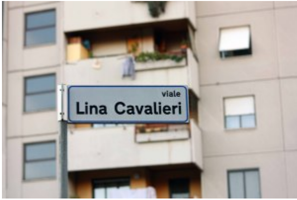
FOTO LINA CAVALIERI