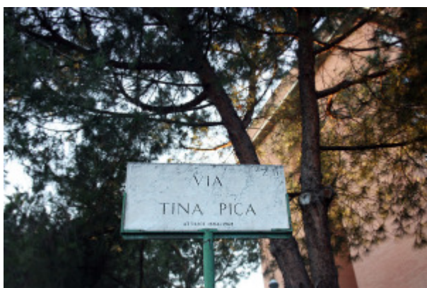
di Marta Rossi Doria

È una donna colta, raffinata, dalla personalità complessa e profonda che, negli anni del secondo dopoguerra, riesce ad affascinare Italo Calvino. Lui, che le dedicherà il romanzo Il Barone Rampante , è un brillante e giovane intellettuale poco più che trentenne. Elsa, più grande di lui, è bella, famosa, protagonista della cultura e della mondanità romane. Il loro è un amore clandestino che si scontra con la morale rigida dell'Italia degli anni Cinquanta. È però un amore intenso e complesso, scandito dalle centinaia di lettere che lo scrittore le invia; l'influenza che Elsa ha su di lui è tangibile nelle parole di Italo: "Amore mio, non avrei mai pensato che innamorarmi di te, incidesse così profondamente in me, fino a toccare, ad aprire una crisi anche nella strumentazione più tecnica del mio lavoro, cioè nel mio stile".