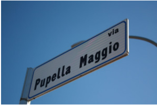
FOTO PUELLA MAGGIO

L'odonomastica del III municipio rievoca anche molte attrici di teatro, per esempio Pupella Maggio, il cui vero nome era Giustina. Come lei stessa racconta, a due anni venne portata in scena dentro uno scatolone, legata proprio come una bambola perché non scivolasse fuori. Così il suo destino fu segnato: da "Pupatella", attraverso la poupée francese, divenne per tutti "Pupella" nel teatro e nella vita.