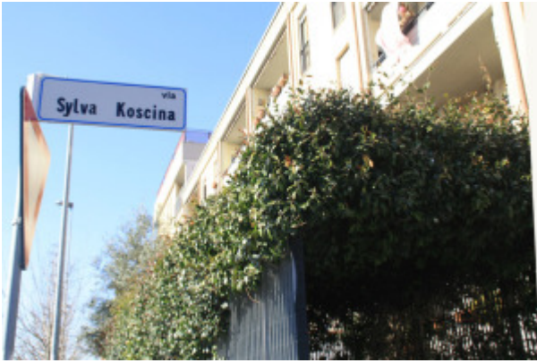
FOTO SYLVA KOSCINA

Altre figure sono più note e sono quelle che hanno fatto vivere e crescere il cinema italiano nel corso del Novecento. Troviamo fra loro Sylva Koscina: il mondo dello spettacolo le ha ritagliato addosso il ruolo di donna seducente e ammaliatrice; la sua bellezza, gli atteggiamenti da diva, le pagine di cronaca rosa l'hanno consegnata al grande pubblico come un mito senza età. Ma riferendosi a se stessa Sylva Koscina parlava di infelicità e di mancanza di amore, di successo ma anche di scelte sbagliate pagate a caro prezzo.