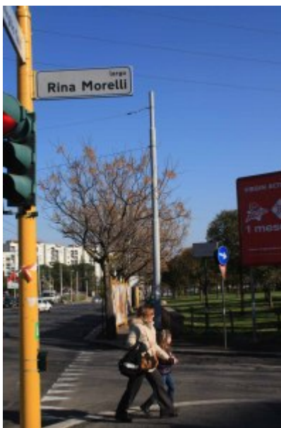
FOTO RINA MORELLI

L'odonomastica del III municipio rievoca anche molte attrici di teatro, per esempio Pupella Maggio, il cui vero nome era Giustina. Come lei stessa racconta, a due anni venne portata in scena dentro uno scatolone, legata proprio come una bambola perché non scivolasse fuori. Così il suo destino fu segnato: da "Pupatella", attraverso la poupée francese, divenne per tutti "Pupella" nel teatro e nella vita.