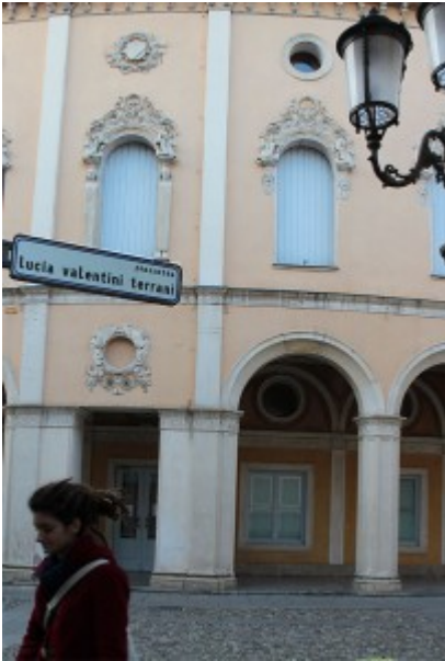
Foto 13 Piazzetta Lucia Valentini Terrani