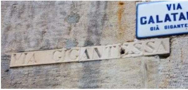
Foto 3 Via Gigantessa