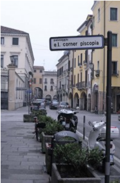
Foto 1 Passaggio Cornaro Piscopia