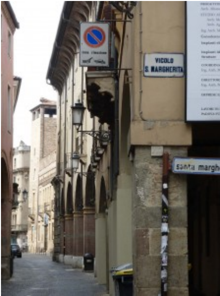
Foto 4 Targa Vicolo Santa Margherita