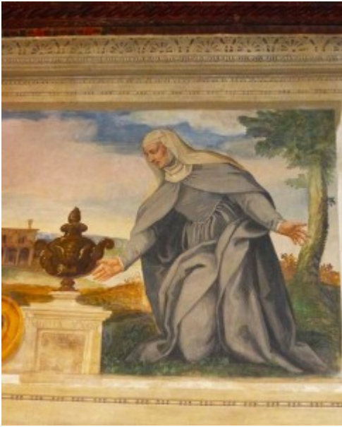
Foto 6 S. de Cetto nell'atto di donare l'ospedale di San Francesco – Dipinto di Dario Varotari, 1579

Foto 5 Ex sede dell'ospedale San Francesco Grande ora sede del MUSME.