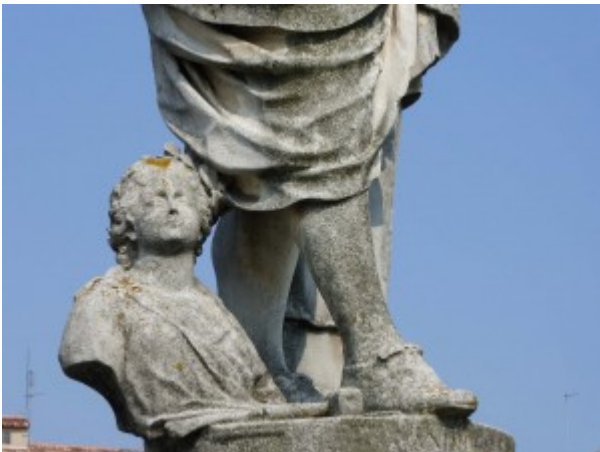
Foto 8 Busto di Gaspara Stampa in Prato della Valle

Dal Prato della Valle attraverso un breve percorso per le antiche strade s'incontra via Isabella Andreini Canali (Padova 1562-Lione 1604): letterata, scrittrice, rimatrice e attrice. Isabella è stata un'artista conosciuta e apprezzata a livello europeo, girando con la Compagnia dei Gelosi. Venne ammessa, cosa molto rara per una donna, all'Accademia degli Intenti di Pavia con il nome L'Accesa .