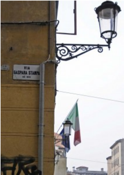
Foto 7 Via Gaspara Stampa