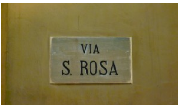
Foto 11 Via S. Rosa

Santa Rosa in vita era Isabella Flores de Oliva (Lima Perù 1586–1617). Figlia di una nobile famiglia caduta in rovina, a vent'anni prese come modello di vita santa Caterina da Siena. Allestì così nella casa materna una sorta di ricovero per i bisognosi, dove prestava assistenza ai bambini e agli anziani abbandonati, soprattutto a quelli di origine india.