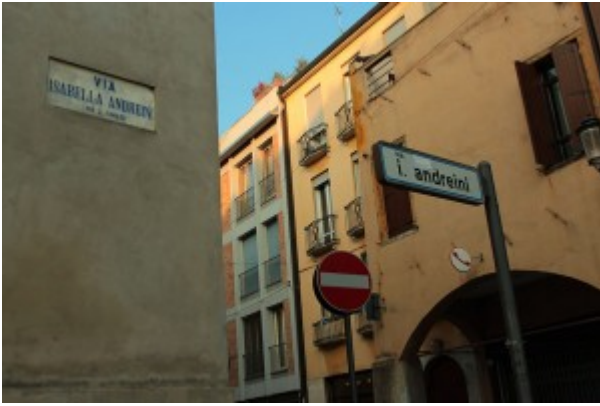
Foto 9 Via Isabella Andreini