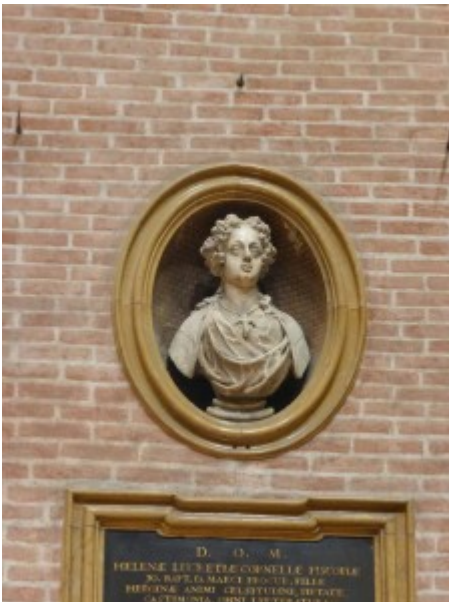
Foto 2 Busto nella navata centrale della Basilica del Santo

Nelle immediate vicinanze, incastonata nel muro di una casa medievale, c'è incisa la scritta via Gigantessa che ricorda l'antico nome della via derivante dalla presenza di una grande statua di donna posta sul pilastro all'entrata di un'abitazione, ora non più presente.