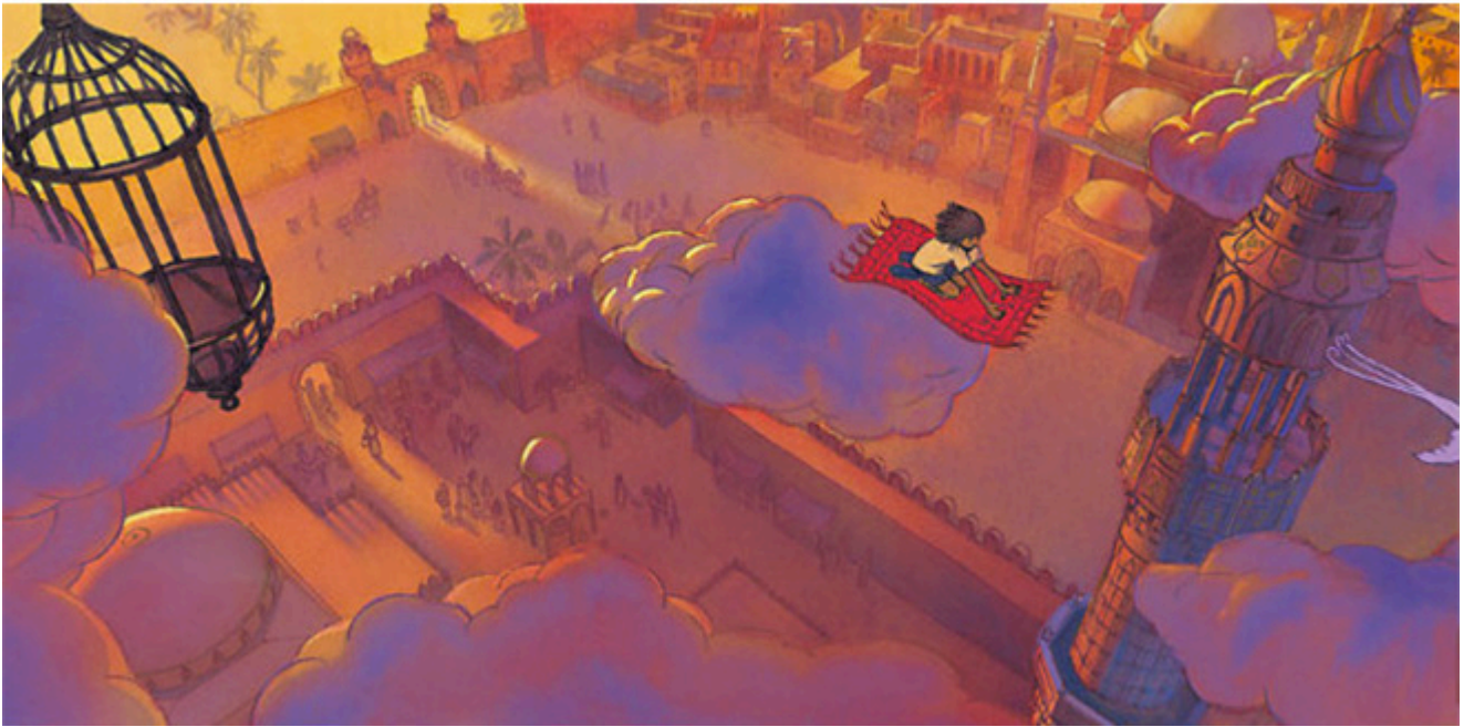
FOTO 1. Viaggio