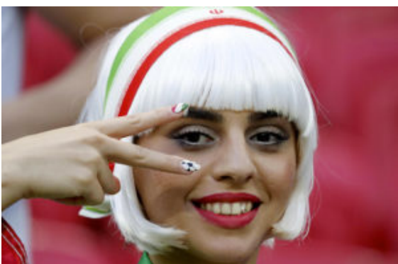
epa06825289 Supporter of

La foto scattata da Frank Augstein dell'AP, ritrae due fan della nazionale durante il match Iran-Portogallo, e la tifosa non indossa come impone la legge iraniana, l'hijab obbligatorio per presentarsi in pubblico. L'osservazione più ovvia è quella che la legge vale nel proprio Paese, dove vige la norma, ma appena fuori dei confini, moltissime si tolgono il velo. Certo, è così, ma la foto ci permette di riflettere meglio su come lo sport, la sua pratica e anche il tifo calcistico, attività quotidiane e banali, siano traguardi importanti da raggiungere in alcuni Stati.