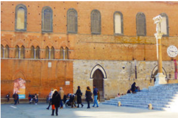
Foto 2. Siena, Ospedale di Santa Maria della Scala

Per tutto l'Ottocento e oltre, in assenza di latte artificiale, il baliatico al proprio domicilio non era affatto raro, e si praticava anche negli ospedali.