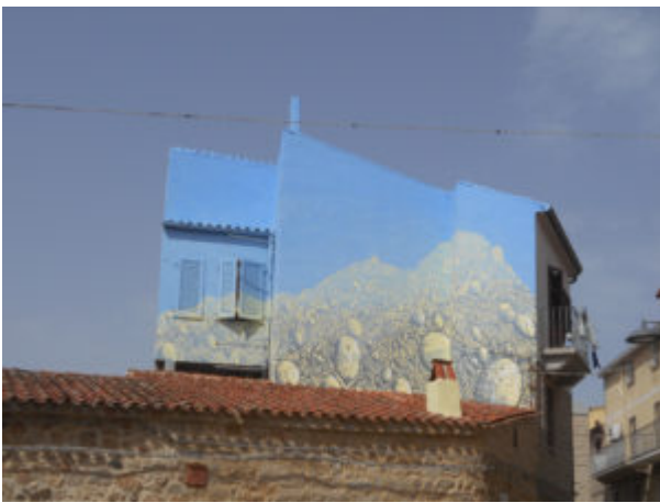
Murale ad Aggius

i manufatti, i simboli, i colori. Proprio l'8 settembre 1981 realizzò la sua opera più famosa (e all'epoca assai controversa): a Ulassai coinvolse, dopo estenuanti discussioni e qualche defezione, l'intera popolazione in quella che viene ritenuta la prima creazione al mondo di "arte relazionale", Legarsi alla montagna . Il lavoro preparatorio fu lungo e complesso e l'opera si realizzò in più giorni: furono infatti utilizzati 27 km. di stoffa celeste per legare fra di loro tutti gli abitanti e alcuni pani dalle forme singolari ("su pani pintau"), in un messaggio di vita e amore, mentre qualcuno in quella data avrebbe voluto ricordare la morte e la guerra. Quando un lembo della stoffa fu portato sulla cima del monte Gedili che sovrasta il paese, si realizzò lo scopo finale: tutto così era legato da un unico filo di memorie condivise, in cui si intrecciavano anche il mito e le leggende locali, con il magico sottofondo musicale del flautista Angelo Persichilli.