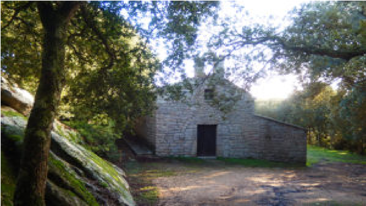
Foto 2. Aglientu, chiesetta campestre di San Pancrazio

La strada 133 conduce all'ex capoluogo provinciale Tempio Pausania (foto di copertina); poco oltre l'abitato, ecco l'imponente mole del nuraghe Majori, circondato da un vero giardino fiorito di piante spontanee, anche rare.