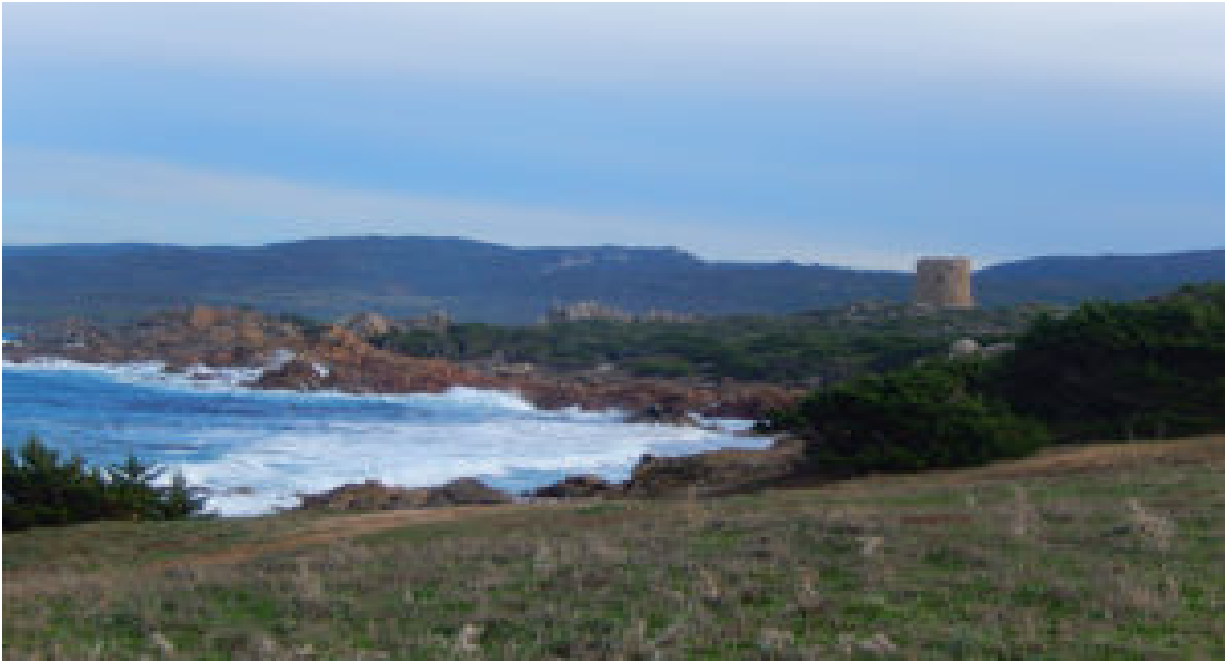
Foto 6. La torre di Vignola