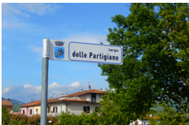
Foto 6. Largo delle Partigiane

Anche altrove in Valdinievole si trovano ricordi dell'eccidio sotto forma di lapidi, monumenti e intitolazioni stradali (vedi: Luoghi della memoria- Istituto Storico della Resistenza- Pistoia) riferite inoltre a partigiani locali e a personaggi storici: dai fratelli Cervi a Bruno Buozzi, da Giacomo Matteotti a Giovanni Amendola, che proprio in questa zona fu picchiato a morte, sulla via verso Pistoia, in località Colonna. Fra le tante merita di essere segnalata una intitolazione, avvenuta il 25 aprile 2016 a Pieve a Nievole , grazie ai contatti presi con l'Amministrazione locale dalla associazione Toponomastica femminile; si tratta di: largo delle Partigiane, unica del genere nell'intera provincia.