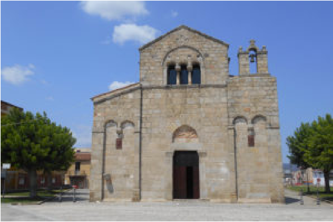
Foto 1. Olbia, basilica di San Simplicio

A Budoni, nota località turistica, è visitabile il Museo dello stazzo e della civiltà contadina, mentre i dintorni di Arzachena offrono molteplici aree archeologiche di notevole interesse: il nuraghe Albucciu, il villaggio la Prisgiona, la tomba dei giganti di Coddu Ecchju, il tempietto nuragico di Malchittu, i circoli megalitici. Oltrepassata Santa Teresa (il cui nome è un omaggio del fondatore Vittorio Emanuele I alla moglie, la regina Maria Teresa d'Asburgo-Este) si entra nel comune di Aglientu. Appena fuori paese, nascosta nel verde, si trova la graziosa chiesetta campestre di San Pancrazio, realizzata in granito; la affianca la "cumbessìa", tradizionale porticato destinato ad accogliere viandanti e pellegrini.