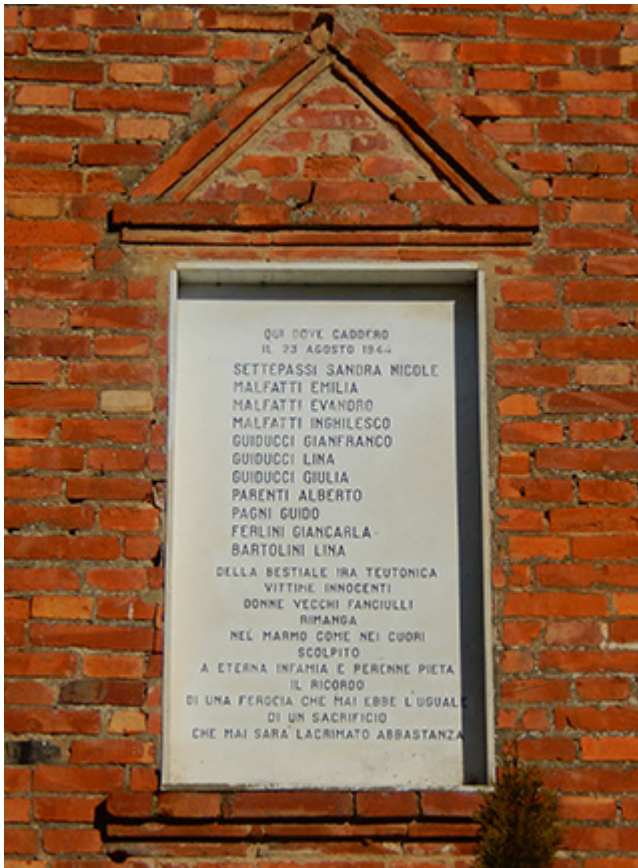
Foto 4. Lapide di Pratogrande