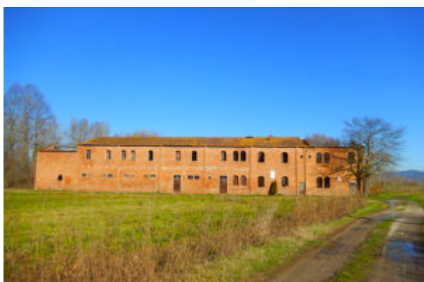
Foto 3. Tabacchificio di Pratogrande

piccolo Centro di documentazione sulla strage che si svolse nelle campagne intorno. Oggi in questa vasta area è bello passeggiare (o andare in bicicletta) lungo gli argini e i canali, osservando i tabacchifici abbandonati e le case ormai in disuso. Incontrando cippi, piccole edicole e la grande lapide sul tabacchificio del Pratogrande è impossibile non soffermarsi sulla strage nazifascista avvenuta il 23 agosto 1944, di cui pure tanti hanno scritto e su cui si continua a indagare.