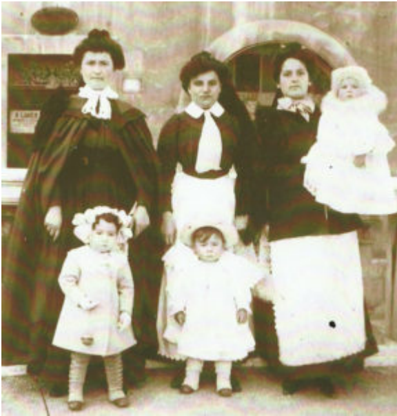
Foto 1. Gruppo di balie della Valdinevole in Francia, inizio Novecento.

Le donne che partivano erano casalinghe, contadine, bisognose di dare un contributo economico alla famiglia, e per farlo lasciavano a casa la loro creatura appena nata, che veniva allattata da una vicina o una parente. La mortalità infantile dei figli delle balie era più alta della norma perché erano privati del latte materno e affidati a donne non sempre sane o poco attente alla cura e all'igiene dei piccoli.