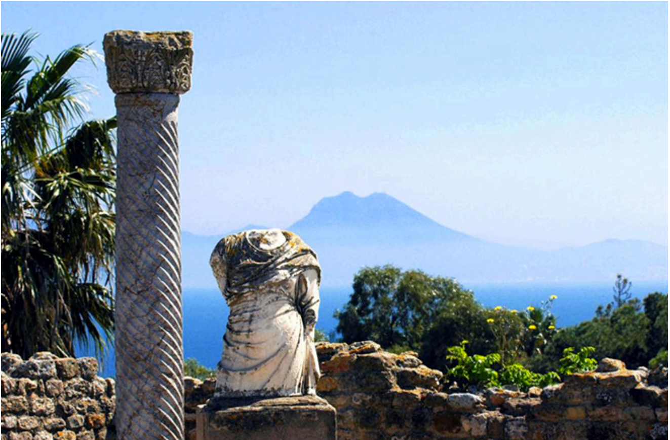
FOTO 2. Cartagine