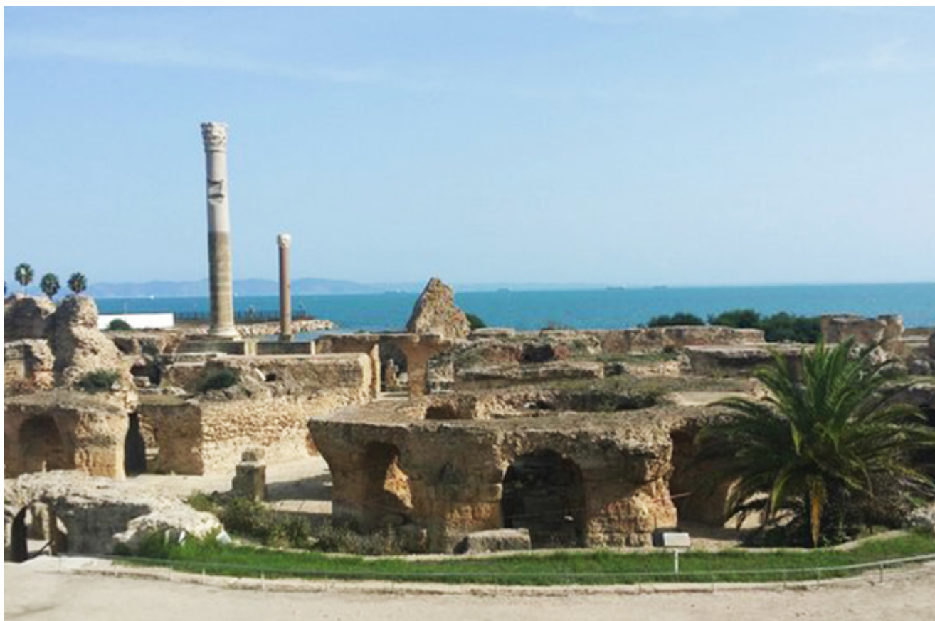
FOTO 1. Collina di Birsa e Rovine di Cartagine

orgogliosamente erede di Cartagine, città fondata dalla mitica regina fenicia, sorella di Pigmalione re di Tiro, già dagli albori ebbe una donna come abile governatrice. Si narra che Didone riuscì a ottenere un regno ben più grande della superficie di una pelle di bue, recintando il perimetro della sua capitale con una corda ottenuta da strisce sottilissime ricavate dal quel cuoio prendendo tanto terreno “quanto ne poteva contenere una pelle di bue” come le aveva concesso il re libico Iarba. Sulla rocca di Birsa, una donna migrante alla ricerca di pace e un destino migliore edificò Cartagine fiorente città nuova poco distante dalla odierna capitale della Tunisia.