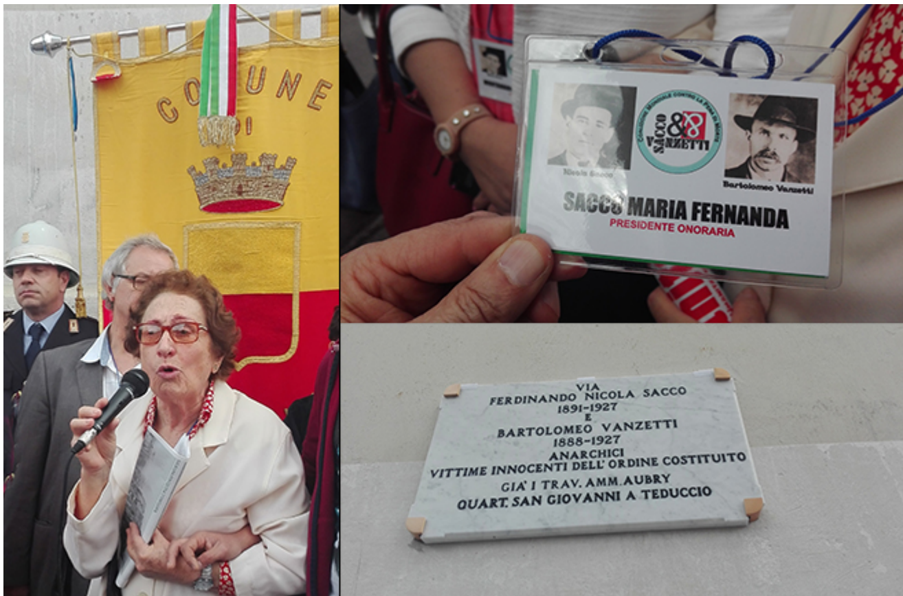
Foto 3. Cerimonia di intitolazione