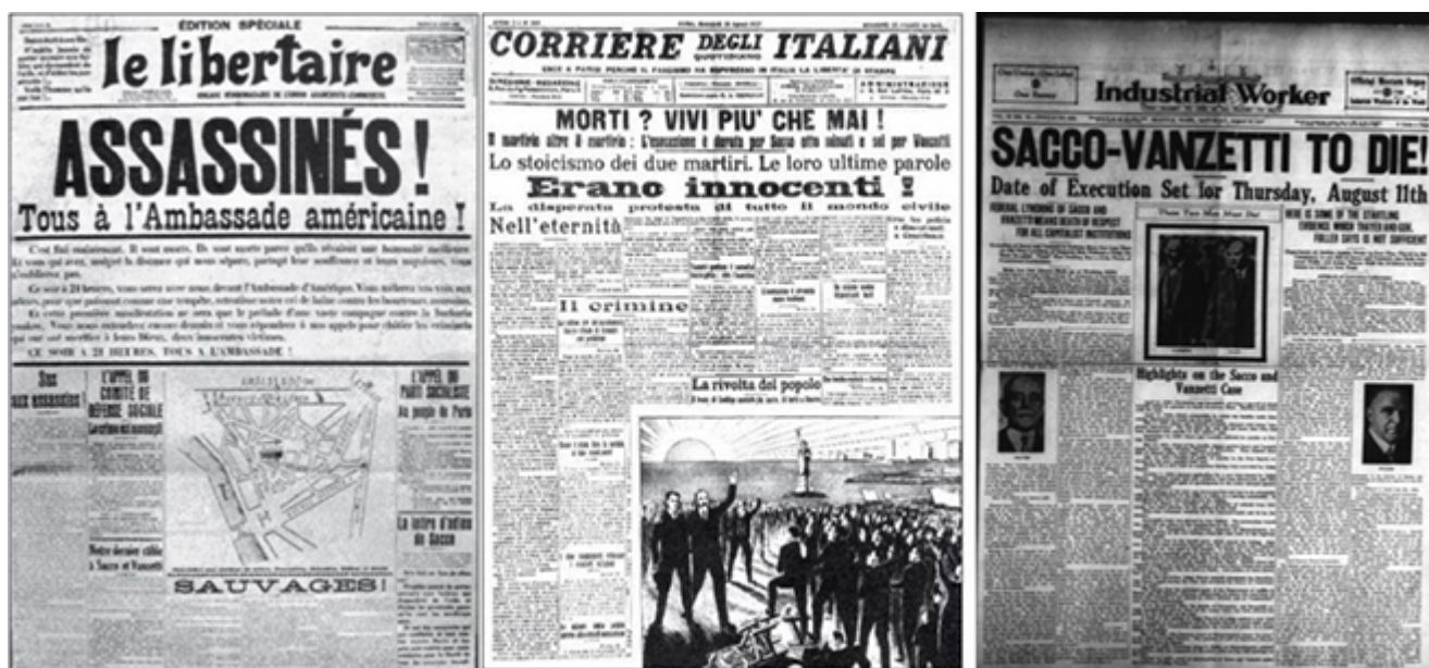
Foto 1. Sacco e Vanzetti. La stampa internazionale

inferiori; in aggiunta, erano di idee politiche radicali. Né Sacco né Vanzetti si consideravano comunisti e Vanzetti non aveva nemmeno precedenti con la giustizia, ma entrambi erano conosciuti dalle autorità locali come militanti radicali coinvolti in scioperi, agitazioni politiche e manifestazioni contro la guerra. Il giudice del processo li definì senza mezzi parole due bastardi anarchici .