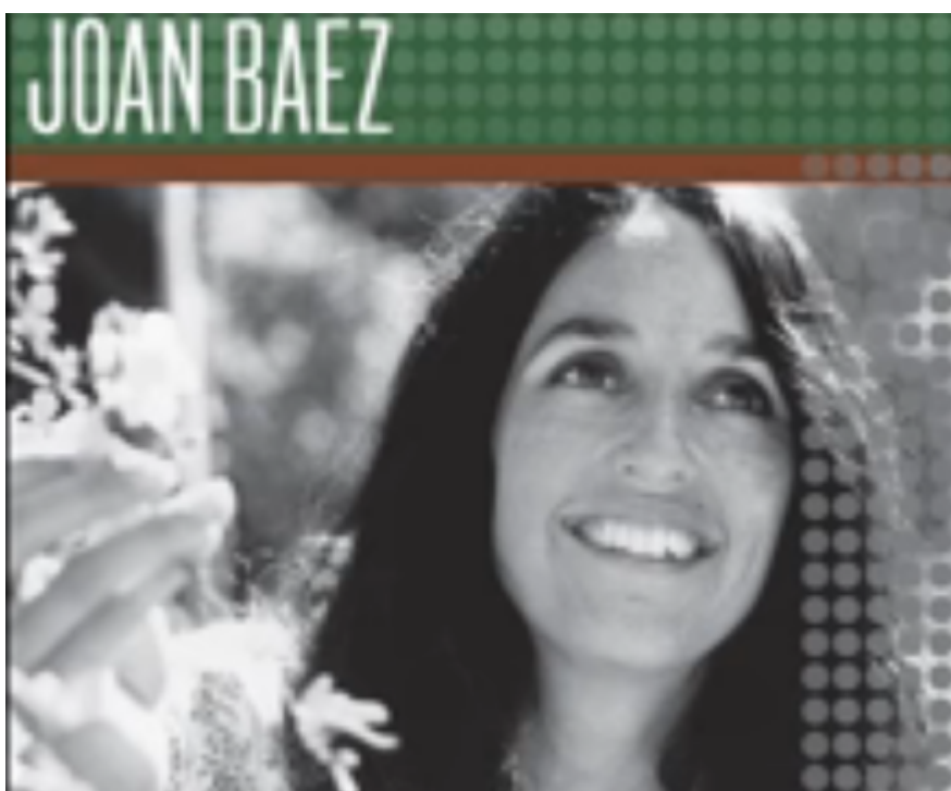
Foto 2. La canzone di Joan Baez su youtube

giustizia pace e libertà che ancora oggi evocano i nomi di Nick e Bart. La ballata celeberrima a loro diretta da una delle militanti per i diritti civili della nostra epoca, la cantautrice Joan Baez, che ha marciato per un mondo migliore senza barriere e segregazioni, contro le guerre, è la dedica migliore che si possa loro porgere: “Onore a voi Nicola e Bart, riposiate in pace qui nei nostri cuori, il momento estremo e finale è vostro, questo sacrificio doloroso è il vostro trionfo”.