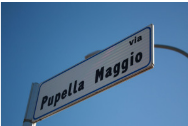
FOTO PUPELLA MAGGIO

Di fronte al grande centro commerciale “Porte di Roma” uno slargo ricorda Giulietta Masina. Non è proprio una piazza, quanto uno snodo di traffico che ruota intorno ad un’aiuola, non sempre ben curata e mantenuta. Federico Fellini è ricordato invece all’inizio della “sua” via Veneto, appena varcate le mura di Porta Pinciana. Certo, quella è la strada che lui ha reso celebre, ma quanti film di Federico sono stati resi unici da Giulietta? Eppure a lei non è toccato lo stesso onore.