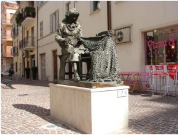
FOTO 3. MONUMENTO ALLA RETARA.

L'attività delle retare è stata a lungo la più diffusa e numericamente significativa.