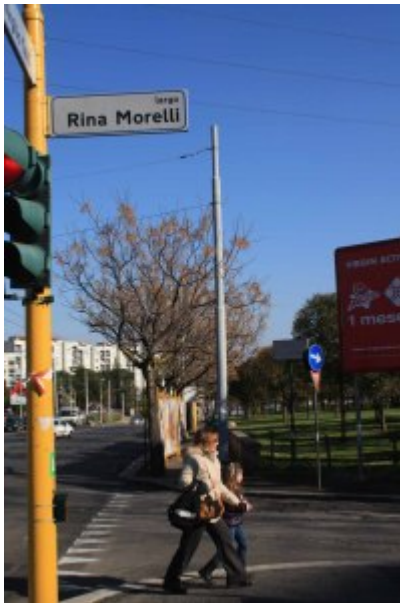
FOTO RINA MORELLI

Rina Morelli ha avuto l'onore di un'intitolazione. Definita da Visconti la più grande di tutte, un mostro sacro del teatro contemporaneo, antidiva per eccellenza, Rina è stata scrupolosa nell'aderire ai personaggi che interpretava, da Cechov a Shakespeare, da Goldoni a Pirandello; la sua voce, duttile ed espressiva, è stata prestata nei doppiaggi delle pellicole hollywoodiane e così molte attrici, da Bette Davis a Katharine Hepburn, da Ginger Rogers a Judy Holliday, sono diventate per il pubblico italiano delle beniamine.