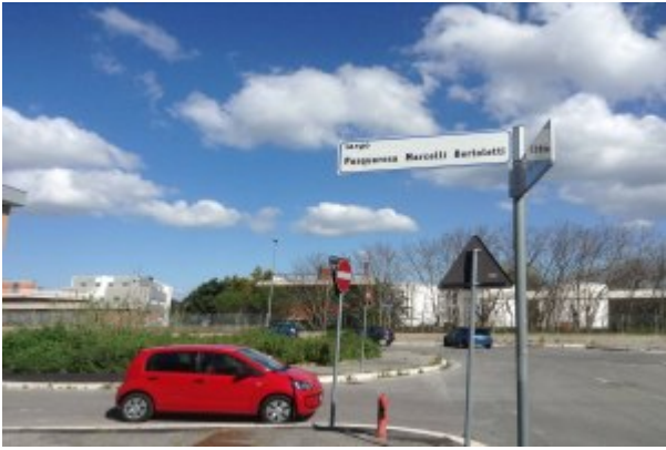
Foto 10. Roma, Largo Pasquarosa Marcelli Bertoletti