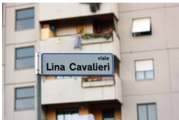
FOTO LINA CAVALIERI

Cercando su Google Map le strade corrono e si snodano sullo schermo del computer formando curve, angoli retti, linee diagonali e i nomi rimandano, nella maggior parte dei casi, a personaggi maschili. Nonostante la recente formazione dei quartieri e dei reticoli viari, la scelta è ancora una volta sbilanciata in favore degli uomini di spettacolo. Si va da via Mario Del Monaco a via Nanni Loy, da via Gian Maria Volontè a via Rino Gaetano, largo Luchino Visconti o viale Antonio De Curtis, poco meno di sessanta nomi per altrettanti spazi pubblici. C’è anche un parco ed è stato dedicato all’attore Angelo Musco.