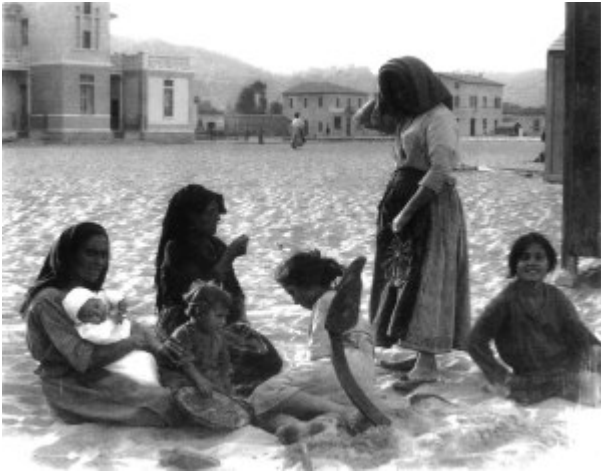
FOTO 1. DONNE SULLA SPIAGGIA.