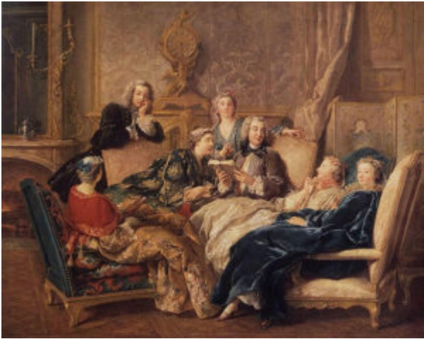
Foto 1. Lettura di Moliere in un salotto letterario del '700

Quello che si terrà venerdì 25 maggio alle ore 18 nella sala al piano terra della Biblioteca comunale di Villa Leopardi a Roma è il 4° salotto letterario romano di Toponomastica femminile. Qui, al contrario del mondo greco, le protagoniste sono le donne: Toponomastica femminile vuole infatti accendere la luce, attraverso l'interpretazione di brani e di versi di scrittrici, poetesse, giornaliste, filosofe ricordate nella toponomastica italiana e straniera, su quanto l'immaginazione femminile ha saputo creare con le parole.