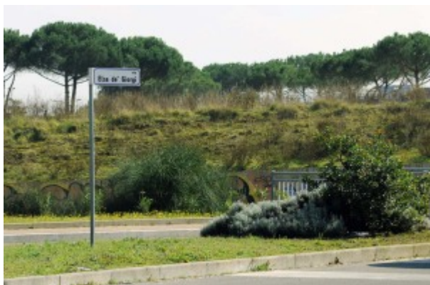
FOTO ELSA DE' GIORGI

Koscina parlava di infelicità e di mancanza di amore, di successo ma anche di scelte sbagliate pagate a caro prezzo.