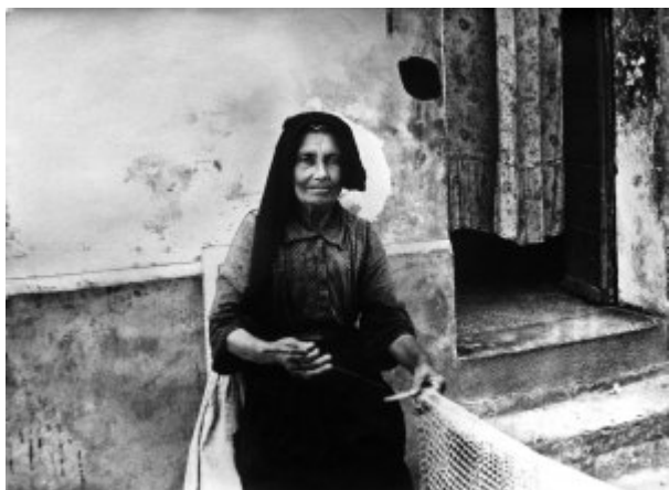
FOTO 5. Vecchia retara.

In inverno il più delle volte l'attività si svolgeva all'interno, di giorno vicino alla finestra e la sera vicino al fuoco continuando a lavorare fino a notte fonda.