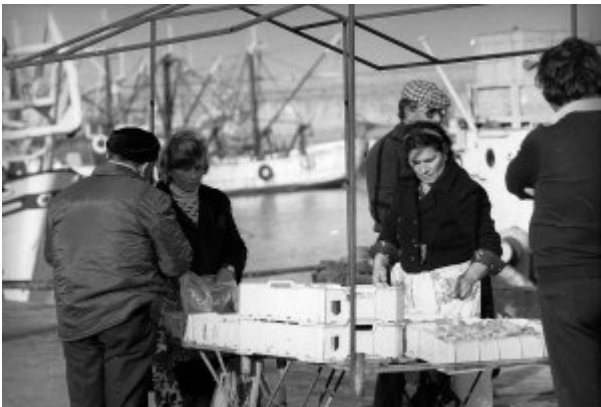
FOTO 10. Pescivendole.