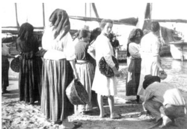
FOTO 8. Donne al rientro delle barche.

Sulla riva del mare scrutavano l'orizzonte aspettando le barche di ritorno dalla pesca.