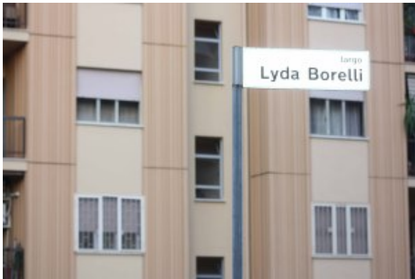
FOTO LYDA BORELLI

Le protagoniste femminili sono meno della metà. Sono donne che si sono distinte nel canto (Lina Cavalieri), nella rivista (Wanda Osiris) o che hanno contribuito allo sviluppo del cinema muto come Dina Galli, Rina De Liguoro, Maria Melato o Lyda Borelli, considerata l'ideale della femminilità liberty e dannunziana, caratterizzata da gesti e pose enfatiche. I loro volti sono un po' sbiaditi nella memoria collettiva, eppure la loro carriera è stata importante e alcune di loro sono state vere e proprie dive.