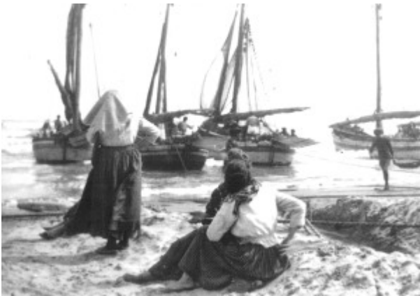
FOTO 2. DONNE IN ATTESA DELLE BARCHE.

All'importante ruolo svolto dalle donne nell'economia marinara, un lavoro fondamentale e continuo rimasto sempre nell'anonimato, il Comune di San Benedetto del Tronto ha dedicato una sezione del "Museo del mare" e ha collocato nelle sue strade il monumento bronzeo dedicato al lavoro delle retare, opera dello scultore Aldo Sergiacomi, inaugurato nel 1991.