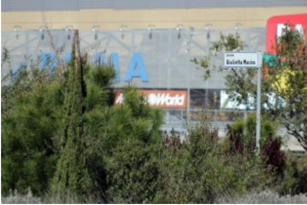
GIULIETTA MASINA

Di fronte al grande centro commerciale “Porte di Roma” uno slargo ricorda Giulietta Masina. Non è proprio una piazza, quanto uno snodo di traffico che ruota intorno ad un’aiuola, non sempre ben curata e mantenuta. Federico Fellini è ricordato invece all’inizio della “sua” via Veneto, appena varcate le mura di Porta Pinciana. Certo, quella è la strada che lui ha reso celebre, ma quanti film di Federico sono stati resi unici da Giulietta? Eppure a lei non è toccato lo stesso onore.