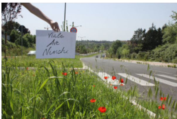
FOTO AVE NINCHI

simpatia, spontanea nella verve comica, ha calcato con successo anche i palcoscenici del teatro di rivista, legando il suo nome agli anni d'oro del teatro Sistina, dove recita nelle commedie musicali di Garinei e Giovannini come Rugantino (1962), Aggiungi un posto a tavola (1975), Accendiamo la lampada (1979). Il suo volto è diventato celebre soprattutto con la televisione, quella in bianco e nero degli anni Sessanta, sia da sola sia al fianco del marito, l'attore Paolo Panelli, con cui forma una coppia comica brillante e di notevole successo. Il talento e la carriera sono stati stroncati molto presto da un tumore: Bice Valori muore il 17 marzo del 1980, a soli cinquantadue anni.