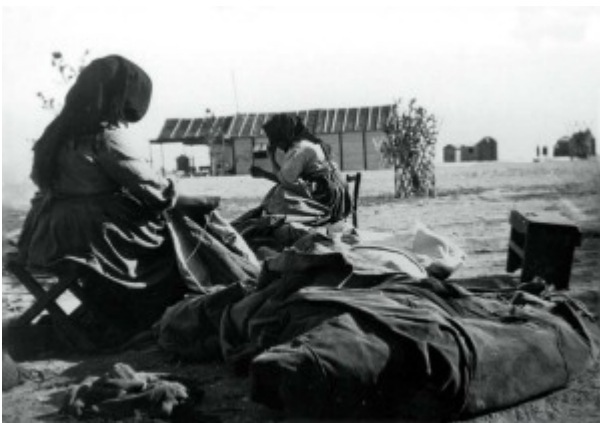
FOTO 7. Velare. Foto dell'Archivio storico di San Benedetto del Tronto

Erano le donne a occuparsi della confezione e della cura delle vele. Molto spesso erano loro anche a tessere in casa le stoffe con cui realizzarle. Le vele si dedicavano alla cucitura sedute sulla spiaggia, unendo teli di cotone o di canapa. Le donne provvedevano anche alla manutenzione, ricucendo gli strappi e rattoppando i cedimenti dei tessuti dovuti all'usura.