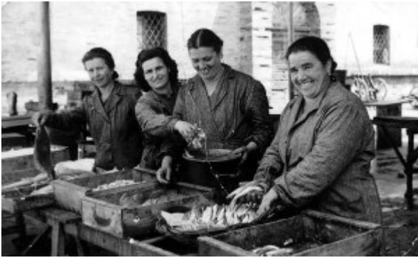
FOTO 9. Pescivendole.