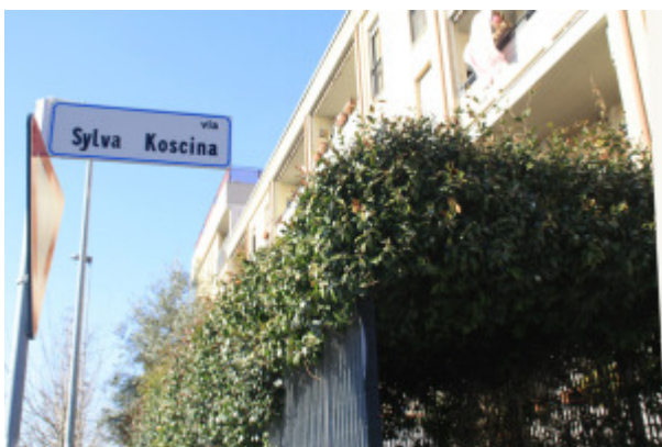
FOTO SYLVA KOSCINA

Le protagoniste femminili sono meno della metà. Sono donne che si sono distinte nel canto (Lina Cavalieri), nella rivista (Wanda Osiris) o che hanno contribuito allo sviluppo del cinema muto come Dina Galli, Rina De Liguoro, Maria Melato o Lyda Borelli, considerata l'ideale della femminilità liberty e dannunziana, caratterizzata da gesti e pose enfatiche. I loro volti sono un po' sbiaditi nella memoria collettiva, eppure la loro carriera è stata importante e alcune di loro sono state vere e proprie dive.