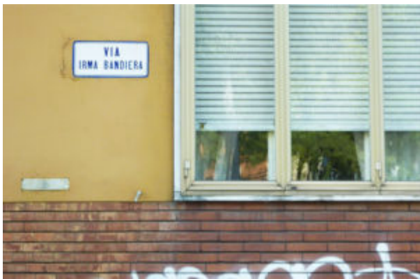
Via Irma Bandiera