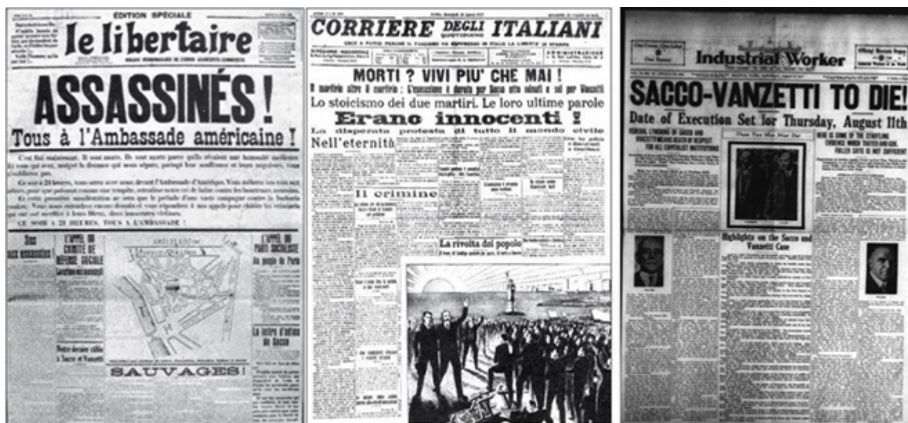
Foto 1. Sacco e Vanzetti. La stampa internazionale

riabilitò completamente la memoria di Sacco e Vanzetti. I due, per l'epoca della storia statunitense, erano le vittime perfette di una politica avversa al pacifismo e alla propaganda contro la guerra che caratterizzava l'attività degli anarchici e di un terrore viscerale delle autorità locali verso il comunismo. In aggiunta erano immigrati italiani, con una scarsa conoscenza della lingua inglese, diversi e, nell'immaginario dell'epoca, individui incivili, inferiori; in aggiunta, erano di idee politiche radicali. Né Sacco né Vanzetti si consideravano comunisti e Vanzetti non aveva nemmeno precedenti con la giustizia, ma entrambi erano conosciuti dalle autorità locali come militanti radicali coinvolti in scioperi, agitazioni politiche e manifestazioni contro la guerra. Il giudice del processo li definì senza mezzi parole due bastardi anarchici .