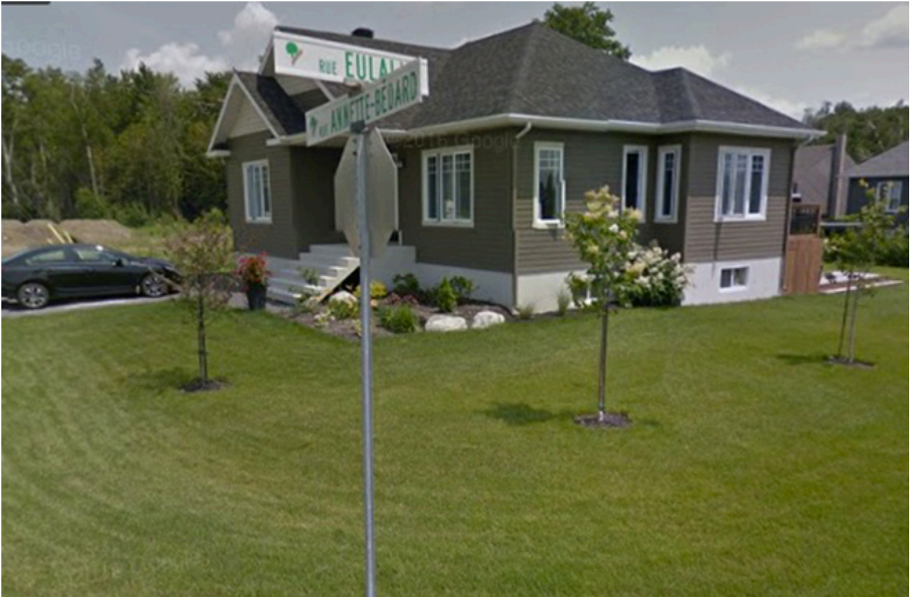
FOTO 3. Rue Annette Bedard