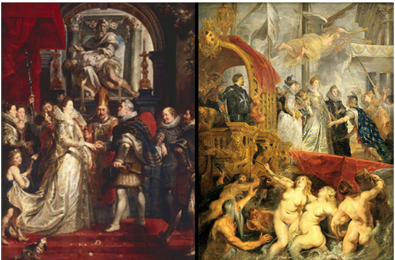
Foto 4. Ciclo Maria de' Medici.

ribaltare tutte le alleanze strette con la Spagna fino a quel momento. L'ex regina tentò di opporsi e di indurre il re a non approvare il piano progettato da Richelieu. La congiura, tuttavia, non ebbe esito positivo, perché il cardinale venne a conoscenza dei vari complotti, e nel corso di un colloquio con Luigi XIII lo indusse a punire i congiurati e a ritornare sulle proprie decisioni. L'11 novembre del 1630 (quello che passerà alla storia come "Journée des Dupes", la "giornata degli ingannati"), Richelieu fu riconfermato primo ministro, i suoi nemici definitivamente rovesciati e Maria de' Medici costretta all'esilio. Dopo aver perso qualunque autorità, la regina madre all'inizio del 1631 venne condotta a Compiègne, agli arresti domiciliari; poco dopo, inviata a Bruxelles in esilio. Per diversi anni visitò molte corti europee per perorare la sua causa e tornare in Francia, ma non vi riuscì e visse nella casa del pittore Rubens, autore del ciclo di Maria de' Medici, esposto al Louvre (Ala Richelieu).