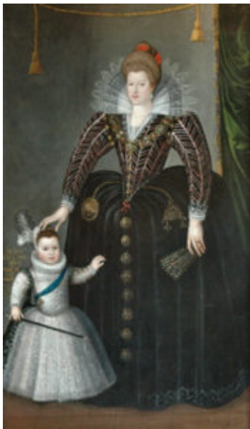
Foto 2. Charles Martin (1562-1646). Maria de’ Medici con suo figlio Luigi XIII. Museo delle Belle Arti di Blois

La loro unione non fu molto felice: Maria dovette sopportare le numerosi amanti del marito e i suoi lati senza scrupoli. Dovette attendere il 13 maggio 1610 per essere incoronata regina, nella Basilica di St. Denis, durante un’assenza del re. Poche ore dopo l’incoronazione, il re venne assassinato e Maria de’ Medici divenne reggente al trono per suo figlio, Luigi XIII, ancora troppo giovane per governare. Le sue abilità diplomatiche le fecero compiere un capolavoro.