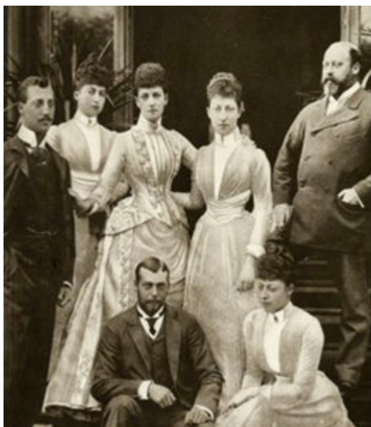
FOTO 1. Re Alberto con la sua numerosa prole tra cui Louisa, la futura Consorte del Governatore Generale del Canada

La dedica amministrativa si ebbe grazie alla sua sesta figlia, Louise, che visse come consorte Vicereale in Canada dal 1878 al 1883 a fianco del marito Governatore della provincia canadese e a cui a sua volta è dedicata la municipalità di Louiseville.