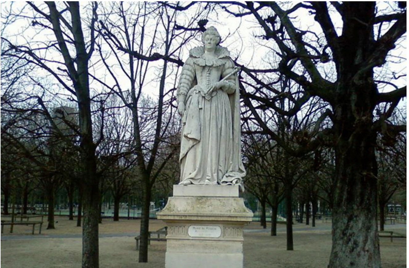
Foto 5. Statua di Maria de Medici ai Giardini del Lussemburgo