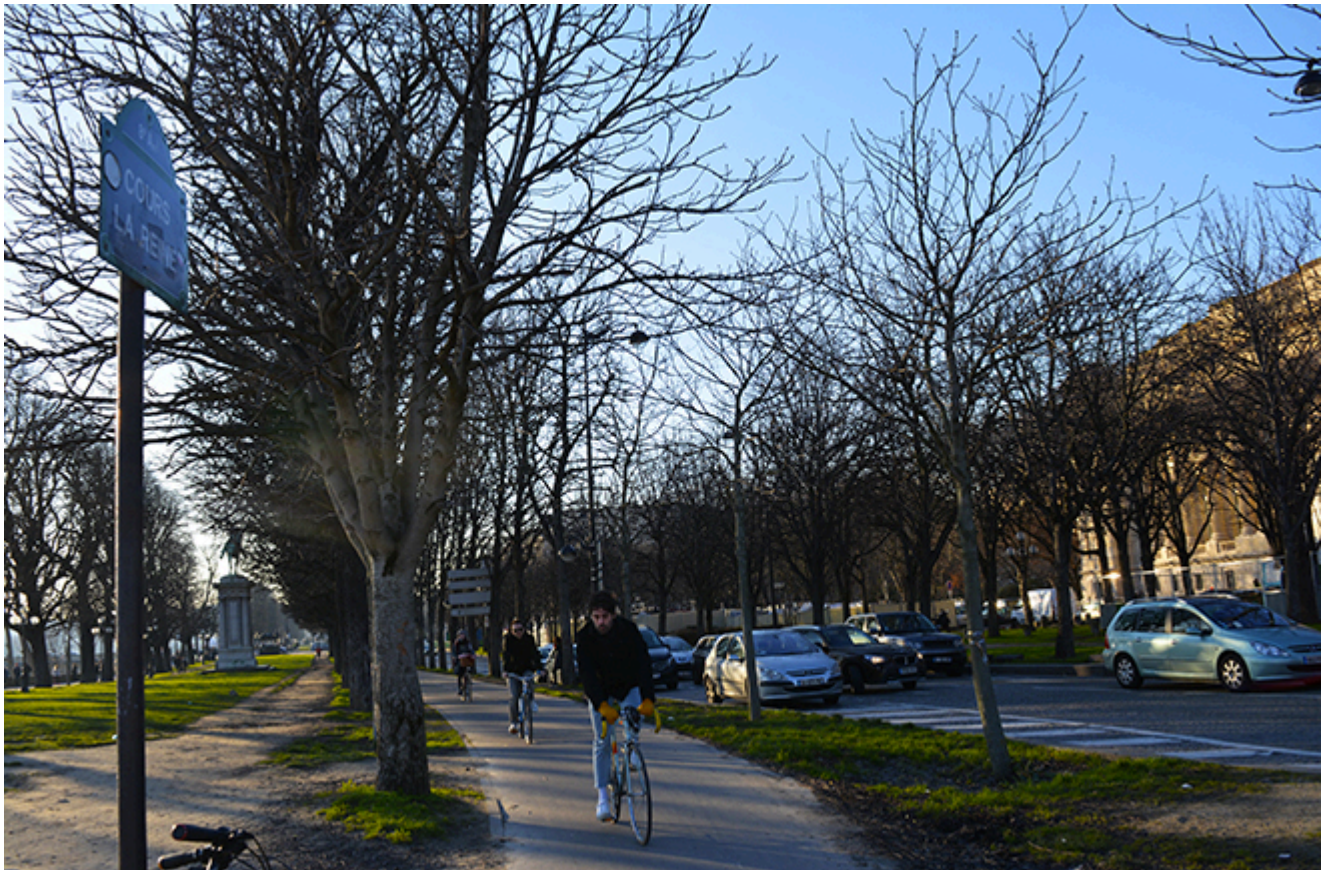
Foto 1. La promenade

Il Cours, compreso tra i ponti di Concorde e Invalides, vicino agli Champs Elysees e al Grand Palais è un indirizzo di prestigio e di glorificazione per i personaggi illustri. Sono installate qui, infatti, grandi statue che glorificano: Simon Bolivar, il Marchese de La Fayette e Alberto I del Belgio.