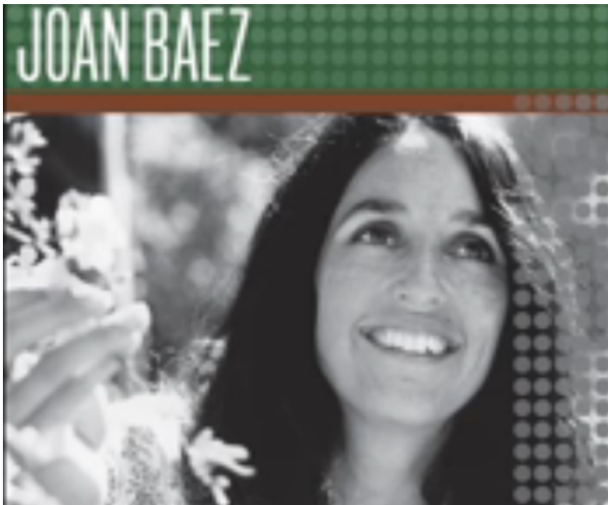
Foto 2. La canzone di Joan Baez su youtube

Per ricordare, e affinché sia di monito la fine ingiusta dei due anarchici italiani, il significato dell'intitolazione a loro nome di una strada del Comune di Napoli. La diversità di origine, di lingua, di cultura non siano mai pretesti di esclusione e persecuzione e ancor meno lo siano le idee di giustizia pace e libertà che ancora oggi evocano i nomi di Nick e Bart. La ballata celeberrima a loro diretta da una delle militanti per i diritti civili della nostra epoca, la cantautrice Joan Baez, che ha marciato per un mondo migliore senza barriere e segregazioni, contro le guerre, è la dedica migliore che si possa loro porgere: "Onore a voi Nicola e Bart, riposate in pace qui nei nostri cuori, il momento estremo e finale è vostro, questo sacrificio doloroso è il vostro trionfo".