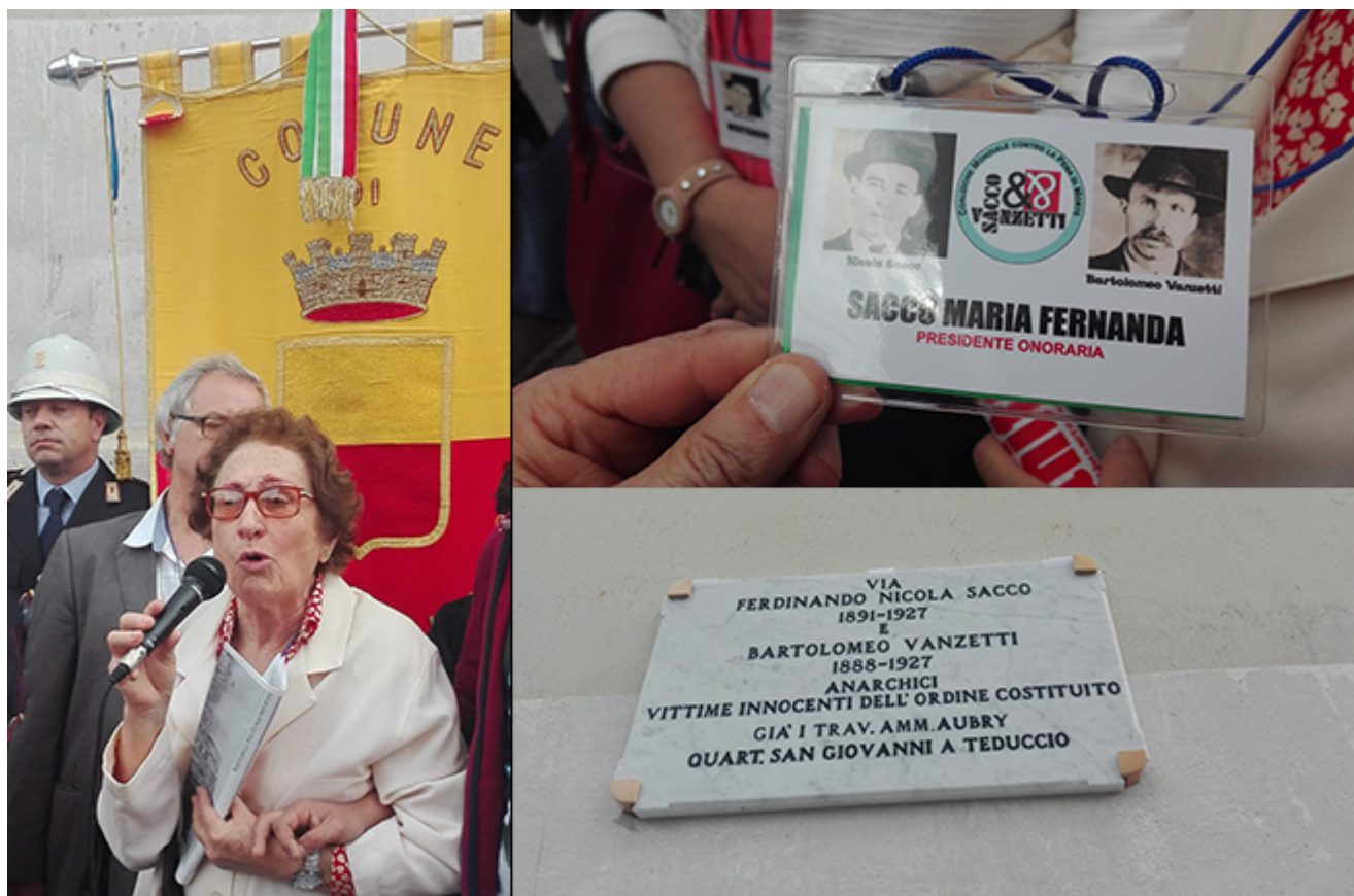
Foto 3. Cerimonia di intitolazione

Vanzetti siano vittime di un vento di pregiudizio e preconcetto che poco rende onore alla nostra democrazia. Primo Maggio di memoria e impegno civile a Napoli, dunque, la toponomastica cittadina si arricchisce di altre figure importanti nella crescita della cultura democratica e resistente della città.