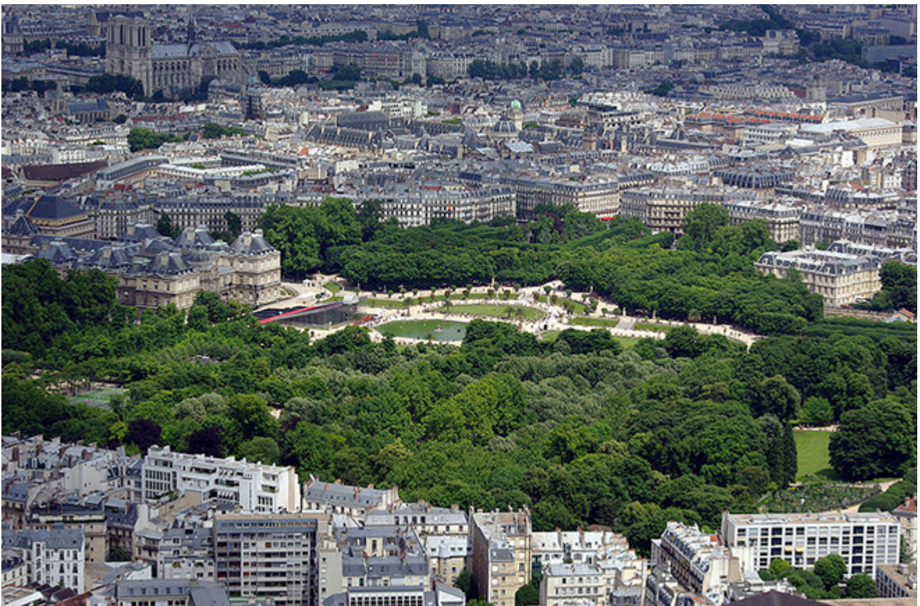
Foto 3. Palazzo e Giardini del Lussemburgo

Nel febbraio 1619, la regina scappò dalla sua prigionia e organizzò una ribellione contro il figlio, seguita da una serie di conflitti che termineranno quando il re decise di perdonare la madre e farla ritornare a corte. Maria de' Medici, di ritorno dall'esilio, si concentrò nella costruzione del suo Palazzo del Lussemburgo e allo stesso tempo, divenne la mecenate di vari pittori parigini, come Guido Reni e Rubens.