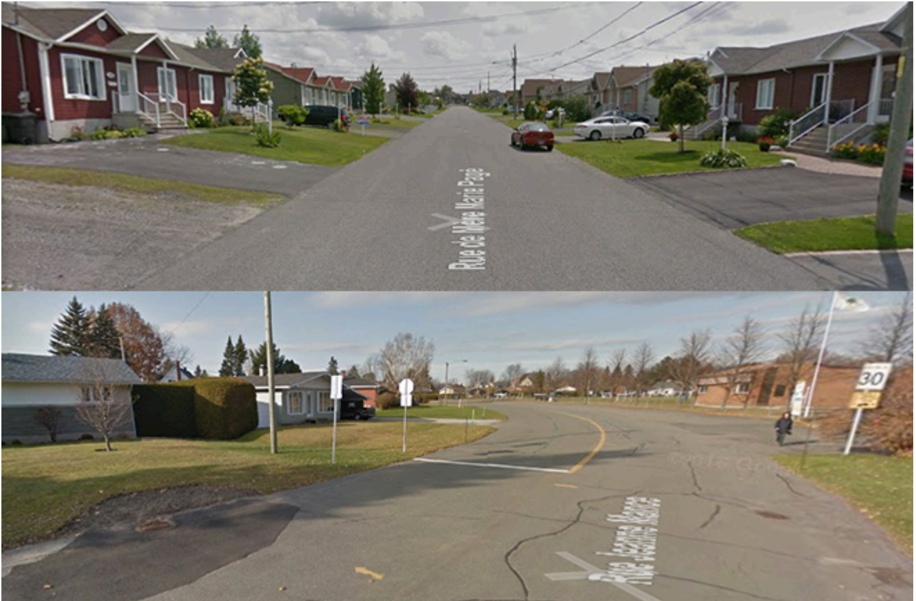
FOTO 1. Rue de Mère Marie Pagé e rue Jeanne Mance