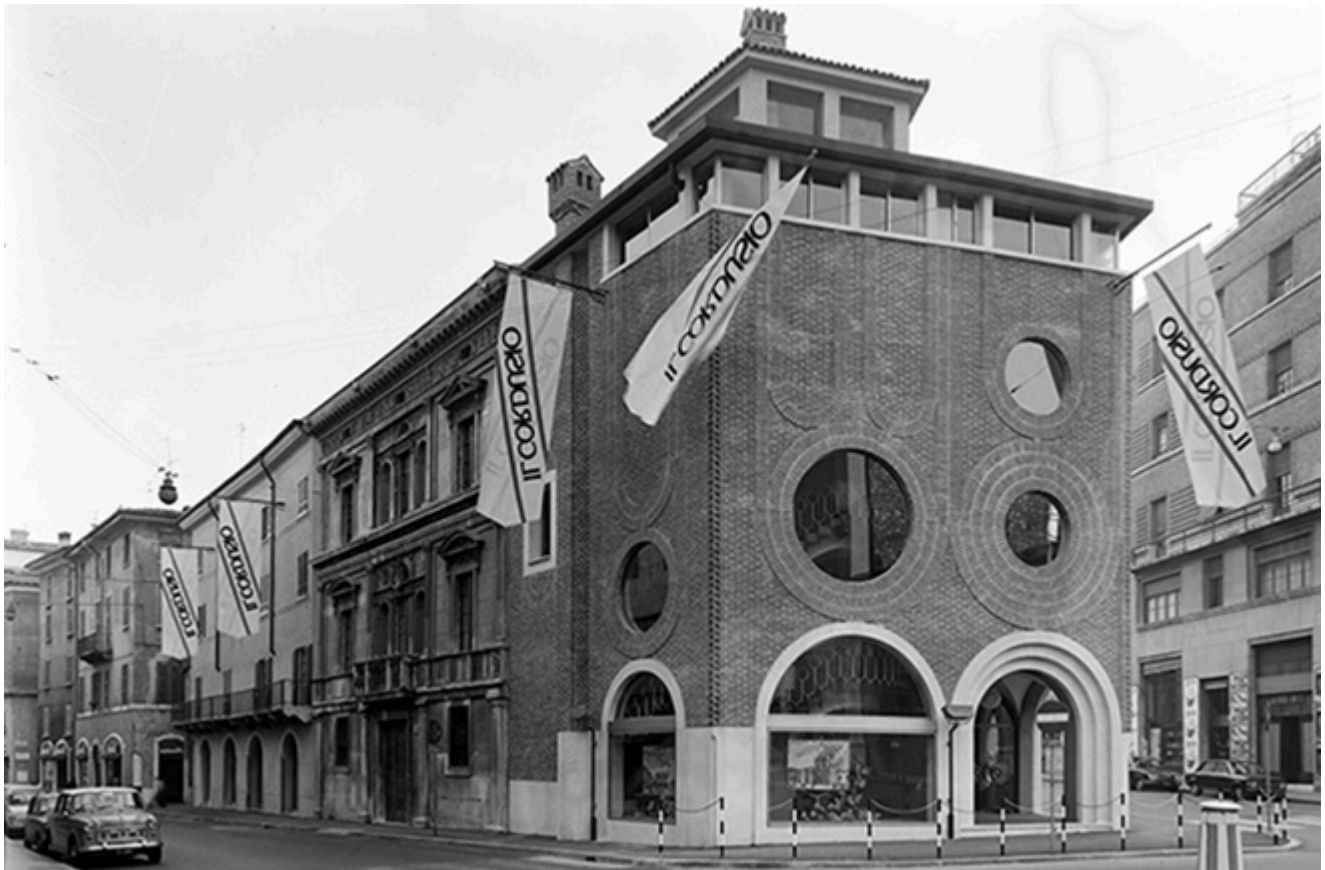
Foto 2. Cordusio a Brescia, parzialmente demolito negli anni '30 e ricostruito negli anni '70 come grande magazzino

In longobardo Ansa deriva da Ans, un nome di dio, e significa divina. Il padre invece, benché Longobardo, porta un nome latino, Verissimo, ed è uno dei nobili più in vista di Brescia, proprietario di molte curtes , e di una splendida abitazione, nella quale fa impartire una certa istruzione ad Ansa e ai suoi due fratelli. Non ci sono pervenute immagini di Ansa, definita da Paolo Diacono nel suo epitaffio " coniux pulcherrima regis " (bellissima sposa del re), ma pare sia una bella donna, alta e robusta, e sicuramente è molto religiosa, giudiziosa nonché istruita.