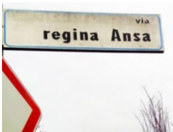
Foto 1. Via Regina Ansa, a Brescia

la funzione chiave svolta dalle sue regine in tale ambito. Al consolidamento della pratica potrebbero aver contribuito i notabili romani che accettano di collaborare con la monarchia longobarda, eredi non solo delle tradizioni romane, ma anche di quelle dei Goti, che prevedono la prassi della reggenza del potere da parte della madre; un altro fattore importante è la tendenza all'ereditarietà della dignità regia, che si sovrappone nel tempo al criterio elettivo. Le regine longobarde sono attive in ambito religioso e impegnate a favore dei poveri, una funzione tipica di sovrane e imperatrici, derivante dall'estensione della dimensione materna all'insieme dei sudditi. Il nome della regina appare spesso accanto a quello del re in atti e donazioni, mentre il suo mantenimento viene assicurato dalle rendite di alcune proprietà terriere, le " curtes domnae regiae ", situate probabilmente presso la capitale Pavia.