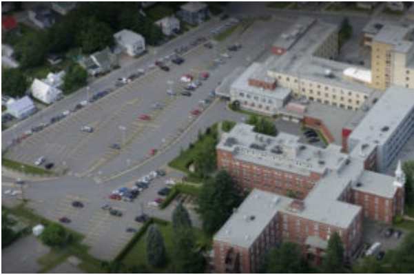
FOTO 2. Ospedale Arthabaska