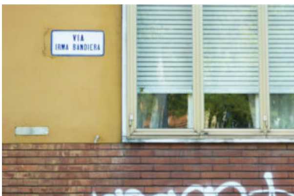
Via Irma Bandiera