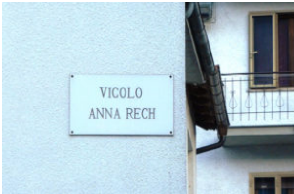
Foto 1. Seren del Grappa

Le levatrici vengono ricordate con molto affetto e stima dalla cittadinanza. Non di rado si trovano dipendenti comunali, quando telefoniamo per avere informazioni e dati sulle loro vite, che si ricordano di loro e a volte dicono: “mi ha fatto nascere!” con un senso di orgoglio.