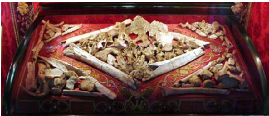
Foto 3. Le reliquie di Santa Giulia, conservate dal 1969 presso la chiesa parrocchiale del Villaggio Prealpino, nel sarcofago dell'altare maggiore

Ansa riesce a svolgere un ruolo determinante durante il regno del marito (756-774), operando nel tradizionale ambito del culto religioso. Nel 759 e negli anni seguenti è spesso menzionata nei diplomi del monastero e appare come protagonista di quella politica di provvidenza a favore di enti religiosi destinata a consolidare il regno. In particolare fonda i monasteri di Leno (in copertina frammento del portale) e Sirmione e contribuisce a trasformare la basilica dei Santi Michele e Pietro, a Brescia, nella grande basilica regia di San Salvatore, alla cui giurisdizione viene sottomessa un'intera rete di complessi monastici tra Lombardia, Emilia e Toscana, una vera e propria federazione direttamente controllata dal sovrano. La regina ottiene la traslazione da Livorno delle reliquie di santa Giulia a Brescia, rinominando di conseguenza la basilica.