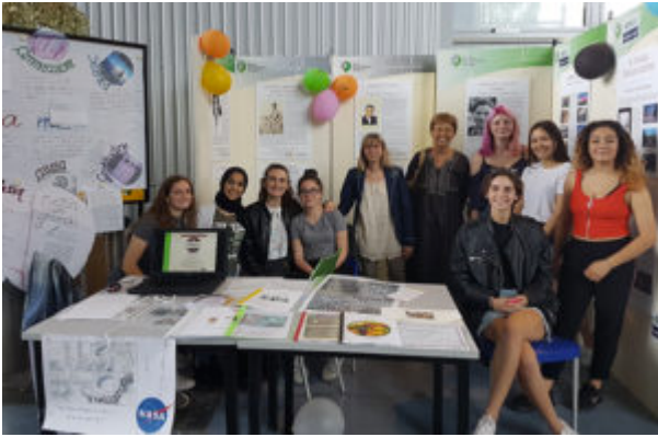
Foto 1. La classe all'opera

Tra le tante figure di Giuste rappresentate (per la definizione di Giusta e il progetto di Alternanza Scuola Lavoro attinente vedi https://www.impagine.it/toponomastica/ricerche/4487-2/ ) ha particolarmente colpito il pubblico una donna forse mai ben identificata come Giusta ma appartenente al popolo e capace di rivendicare diritti fondamentali, come quello della libertà e dell'uguaglianza, senza grandi parole e tuttavia con l'azione silenziosa quanto ferma e decisa.