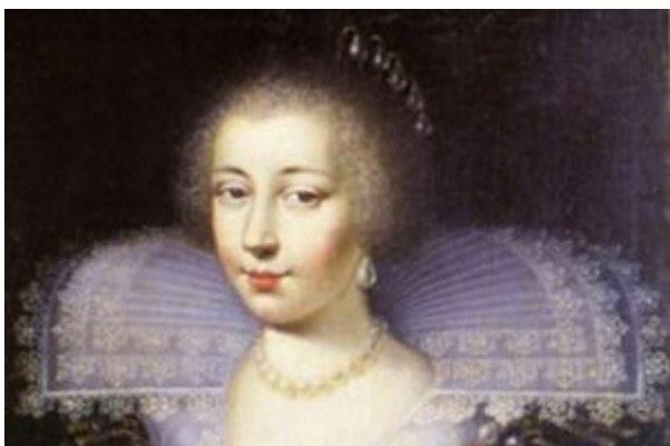
Foto 1. Ritratto di Madama Cristina

intraprendente, Madama Reale – per sottolineare la propria stirpe regale volle per sé questo titolo, che in seguito fu attribuito anche a un'altra duchessa di Savoia, Maria Giovanna Battista di Savoia-Nemours – si ritrova non ancora trentenne finalmente libera di vivere a modo suo: a corte si mormora che si circonda di amanti e si sia scelta un favorito, il conte Filippo di Agliè, bello, colto e ardimentoso e consigliere di fiducia della duchessa. I due si conoscono dai tempi in cui la famiglia ducale, per sfuggire alla peste, era rifugiata a Cherasco, nel Cuneese, e da allora sono molto amici. I soliti ben informati sostengono che addirittura sarebbe Filippo il vero padre dell'erede al trono. Ma Cristina non è tipo da farsi troppo spaventare dal gossip, tanto più che al potere prende gusto e si rivela una politica di razza, destreggiandosi abilmente tra minacce di ogni tipo. I cognati cercano di strapparle la reggenza, mentre il Cardinal Richélieu, alleato pericoloso, mira ad annettere il piccolo stato dei Savoia alla corona francese. Energica, duttile e astuta, la reggente riesce a liberarsi dei suoi nemici interni e a conservare l'indipendenza del ducato sfruttando a proprio vantaggio la rivalità tra la Francia e la Spagna. Anche quando il figlio superstite assume formalmente il potere, nel 1648, Cristina continua a occuparsi della corrispondenza ufficiale, a ricevere gli ambasciatori, e fino alla morte mantiene nelle proprie mani le redini dello Stato.