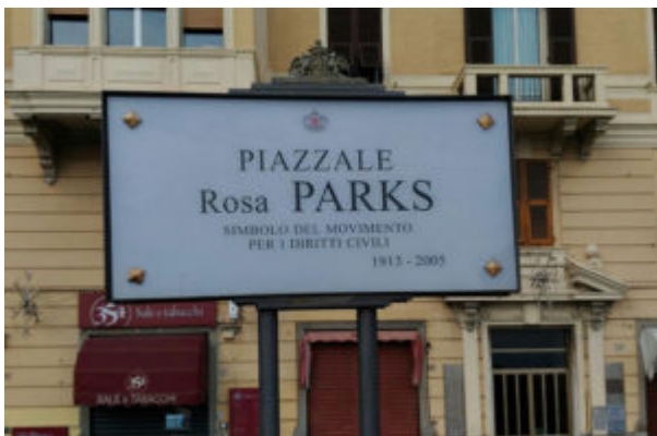
Foto 3. Genova Voltri. Intitolazione a Rosa Parks.

Nel 1956 la Corte Suprema degli Stati Uniti d'America, dopo essere stata informata dell'episodio, ordinò, all'unanimità, che la segregazione sui pullman pubblici dell'Alabama fosse, da quel momento, considerata incostituzionale.