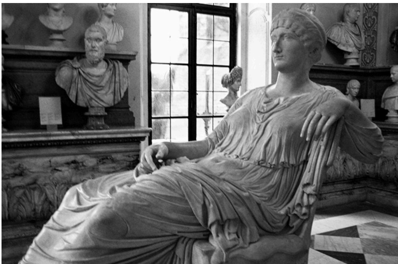
Foto 1. Flavia Iulia Helena ai Musei Capitolini

Il profondo legame che univa Costantino alla madre, sottolineato anche dal biografo dell'imperatore Eusebio di Cesarea, non venne compromesso dalla distanza. Non appena ebbe libertà d'azione, il nuovo imperatore si riavvicinò alla madre invitandola a risiedere nel palazzo di Treviri; ma lei rifiutò, vista la riluttanza della matrigna di Costantino a vivere sotto lo stesso tetto con la donna che l'aveva sempre resa invisibile agli occhi del marito, rimasto profondamente innamorato di Elena fino alla morte.