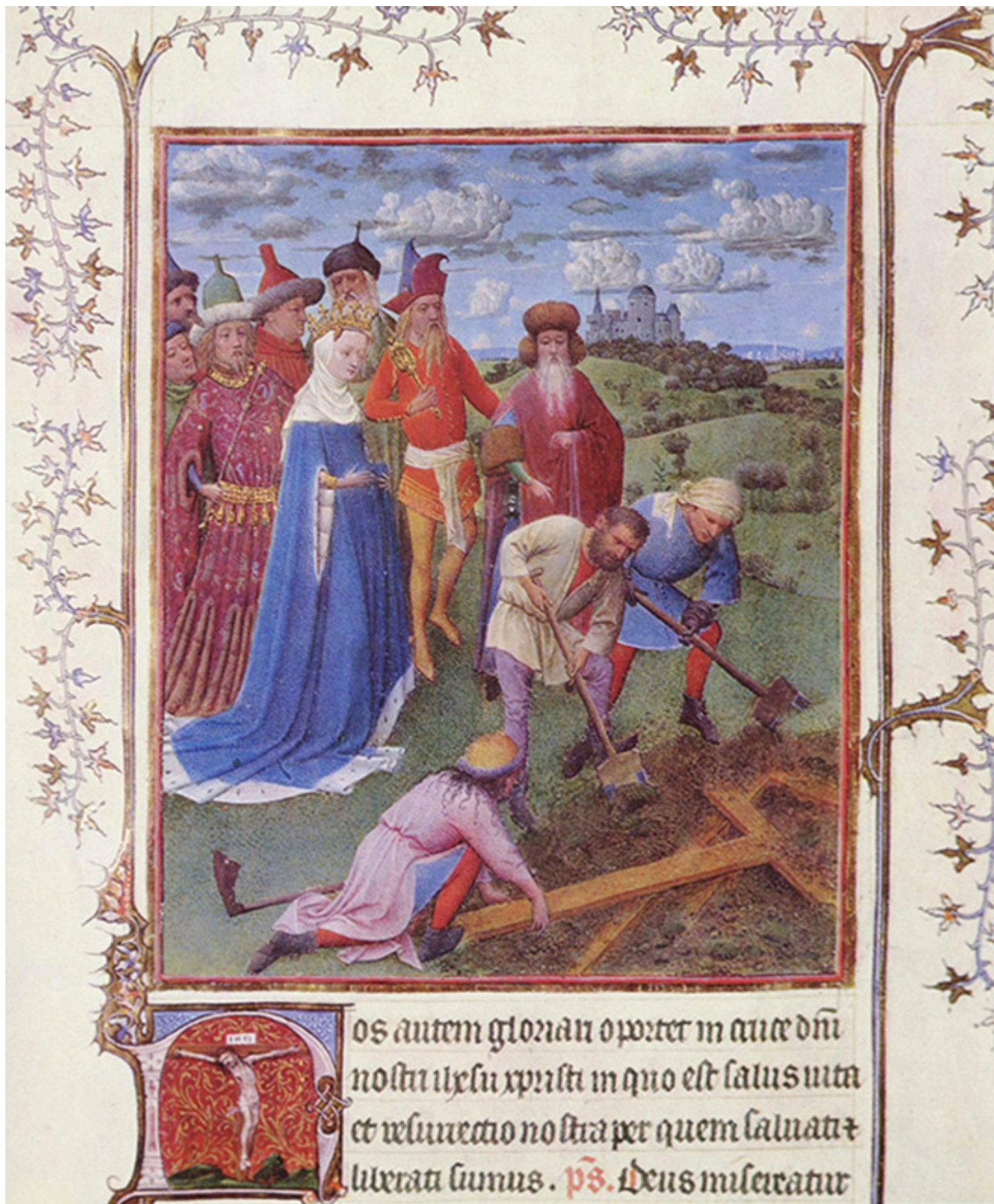
Foto 2. Il ritrovamento della Croce, di Jan Van Eyck

necessità di riabilitare l'immagine del figlio tra i cristiani che convinse Elena a intraprendere un pellegrinaggio il cui itinerario sarebbe diventato una costante durante il medioevo.