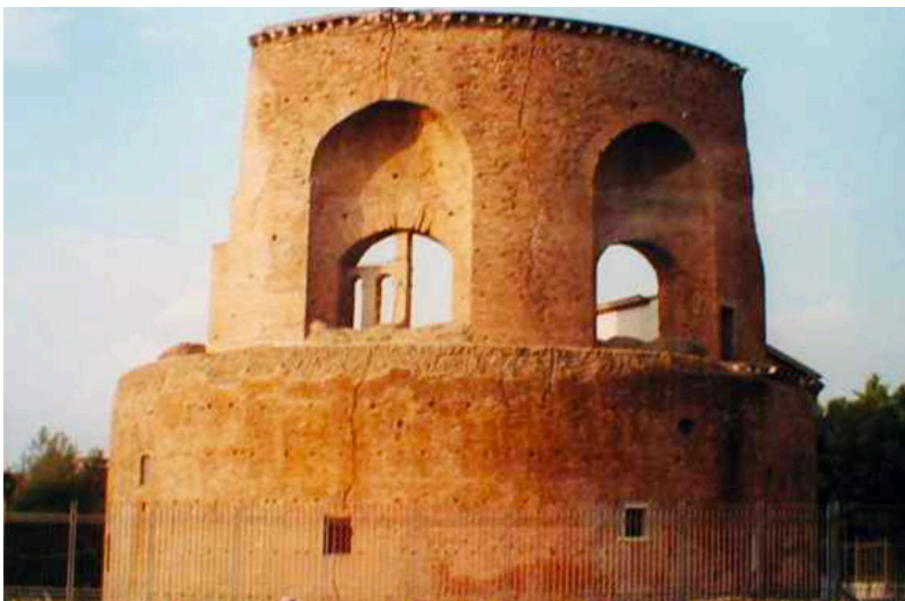
Foto 3. Il mausoleo di Sant'Elena

Flavia Giulia Elena si spense a Treviri nel 329, poco dopo il ritorno dal pellegrinaggio in Terra Santa, con accanto l'amorevole figura del figlio. Per celebrare la madre Costantino fece costruire a Roma uno splendido sarcofago in porfido, e un mausoleo a forma circolare sormontato da una cupola che si trovava sulla via Labicana, nella zona che oggi è chiamata Torpignattara.