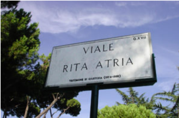
Foto 2. Intitolazione a Roma.

figlia. Per 20 anni la sua tomba è rimasta in stato di abbandono.