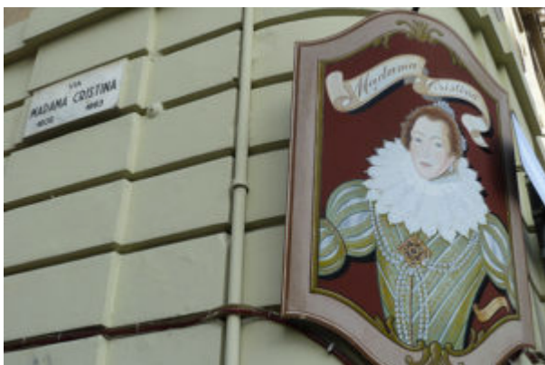
Foto 2. Ritratto e intitolazione di una via centrale a Torino In copertina. La piazza torinese

Questo non bastò a evitarle critiche feroci da parte degli storiografi, che non le perdonarono l'ambizione e la libertà di costumi e criticarono il suo programma di spese, considerate eccessive. Eppure Torino conserva ancor oggi non pochi segni del buon gusto della prima Madama Reale, che trasformò la sua città in una elegante e moderna capitale europea.