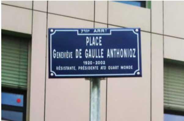
Fig. 4. Intitolazione a Lione

Simone Veil, prima donna presidente del Parlamento europeo e icona della lotta per i diritti delle donne, entra nel Pantheon a un anno dalla sua morte al suono della Marsigliese e dell' Inno alla gioia .