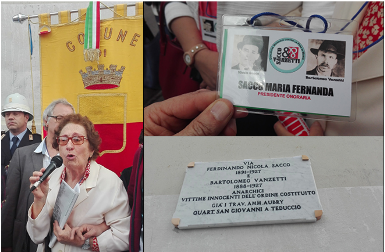
Foto 3. Cerimonia di intitolazione

toponomastica cittadina si arricchisce di altre figure importanti nella crescita della cultura democratica e resistente della città.