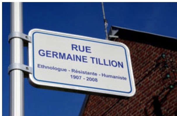
Fig. 3. Intitolazione a Sotteville lès Rouen

biblioteche, anfiteatri, un auditorium, un viale a Montpellier, una strada a Ivry sur Seine e a Sotteville lès Rouen.