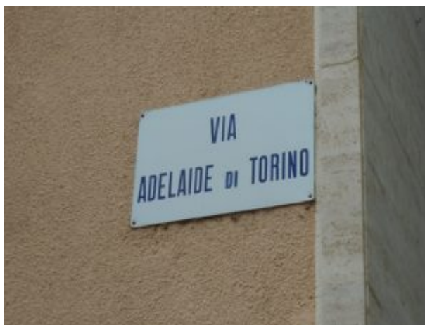
Intitolazione a Pinerolo. Foto

Un enigma accompagna l'ultimo periodo della vita di Adelaide. Venuta a conflitto con Enrico IV, che spinge il figlio Corrado a rivendicare il Canavese come erede di Berta, Adelaide, molto anziana per i tempi e sopravvissuta a quasi tutta la sua discendenza, non si sa se malata, stanca e presaga della prossima fine oppure abbandonata dai propri sostenitori, rinuncia alla lotta. Si rifugia a Canischio, sopra Cuorné, nella Valle dell'Orco, e in questo sperduto villaggio fra le montagne muore in solitudine il 19 dicembre 1091. La sua sepoltura non è mai stata individuata.