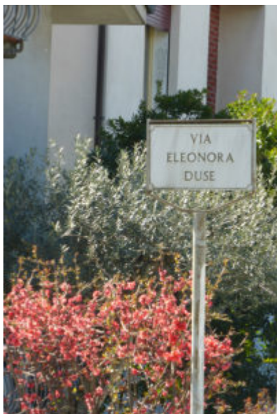
Fig. 2. Intitolazione a Cornuda (TV).

osservare gli aspetti più interessanti della vita delle attrici dell'Ottocento è senz'altro quella di Giacinta Pezzana. Meno nota al pubblico di Eleonora Duse, Giacinta Pezzana è però una figura emblematica dello spaccato femminile ottocentesco, racchiudendo nella sua esperienza di vita una carriera lavorativa di successo, un attivismo politico e sociale, e una vita privata capace di rompere molti dei modelli dell'epoca.