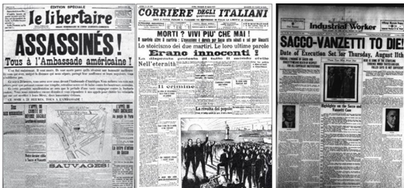
Foto 1. Sacco e Vanzetti. La stampa internazionale

degli anarchici e di un terrore viscerale delle autorità locali verso il comunismo. In aggiunta erano immigrati italiani, con una scarsa conoscenza della lingua inglese, diversi e, nell'immaginario dell'epoca, individui incivili, inferiori; in aggiunta, erano di idee politiche radicali. Né Sacco né Vanzetti si consideravano comunisti e Vanzetti non aveva nemmeno precedenti con la giustizia, ma entrambi erano conosciuti dalle autorità locali come militanti radicali coinvolti in scioperi, agitazioni politiche e manifestazioni contro la guerra. Il giudice del processo li definì senza mezze parole due bastardi anarchici .