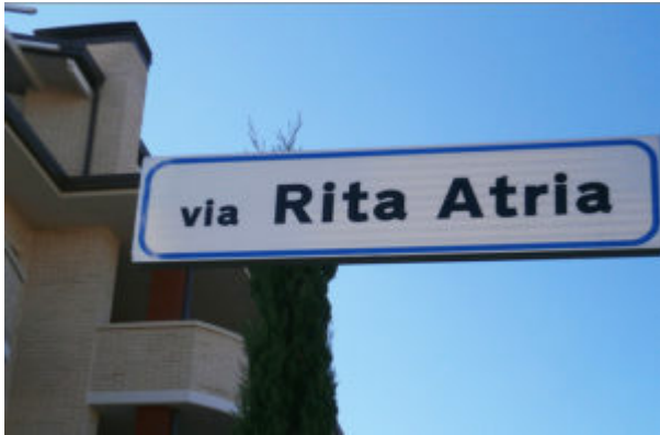
Foto 3. Intitolazione a Pontefelcino (PG).