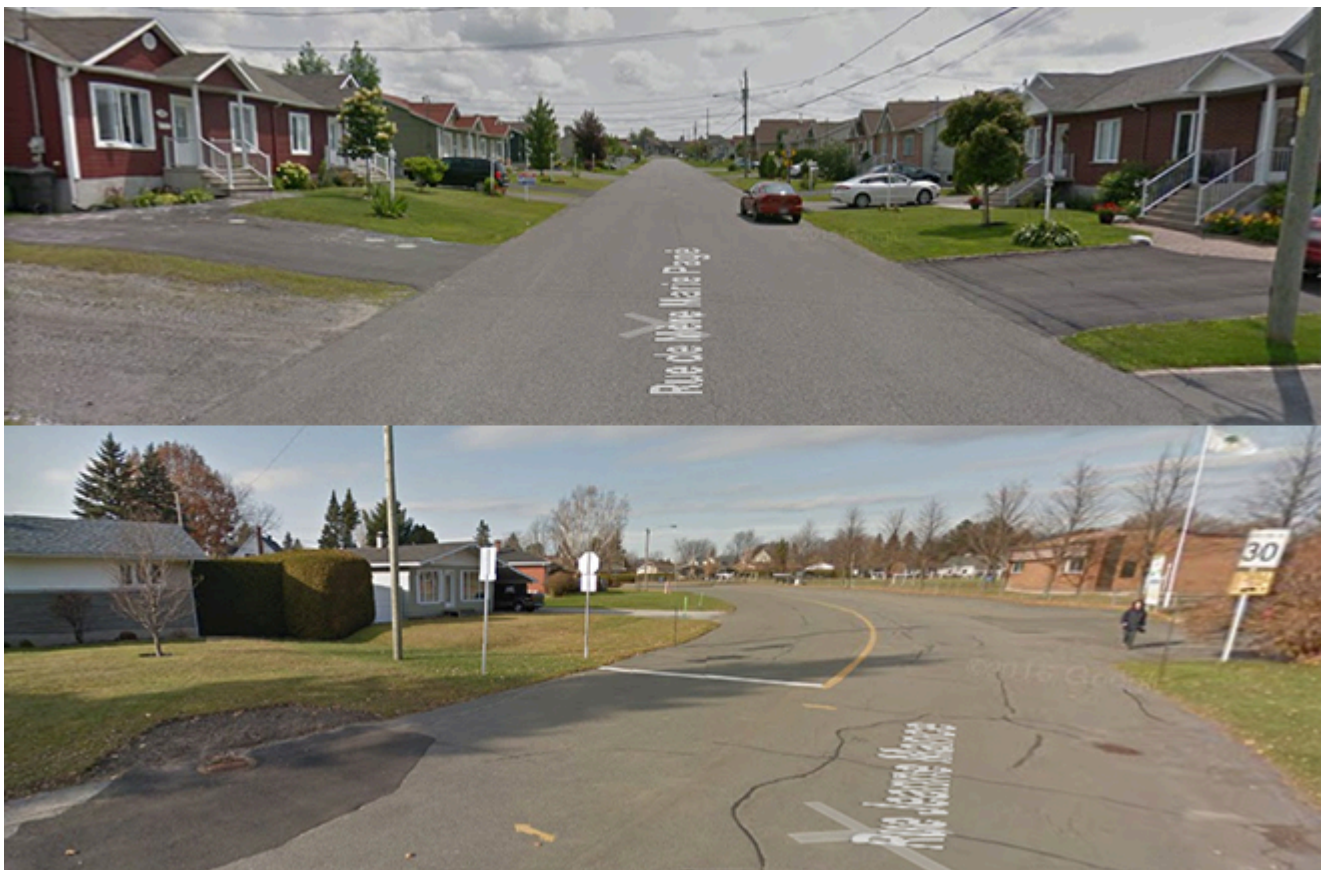
FOTO 1. Rue de Mère Marie Pagé e rue Jeanne Mance

Qui nel 1642 dedica il suo operato alla cura delle bisognose e dei poveri, fondando l'Ospedale Dieu di Montréal, il primo ospedale dell'America del Nord, di cui seguirà i lavori di realizzazione e ne diventerà direttrice dal 1659 al 1673 accettando la presenza di religiose a servizio.