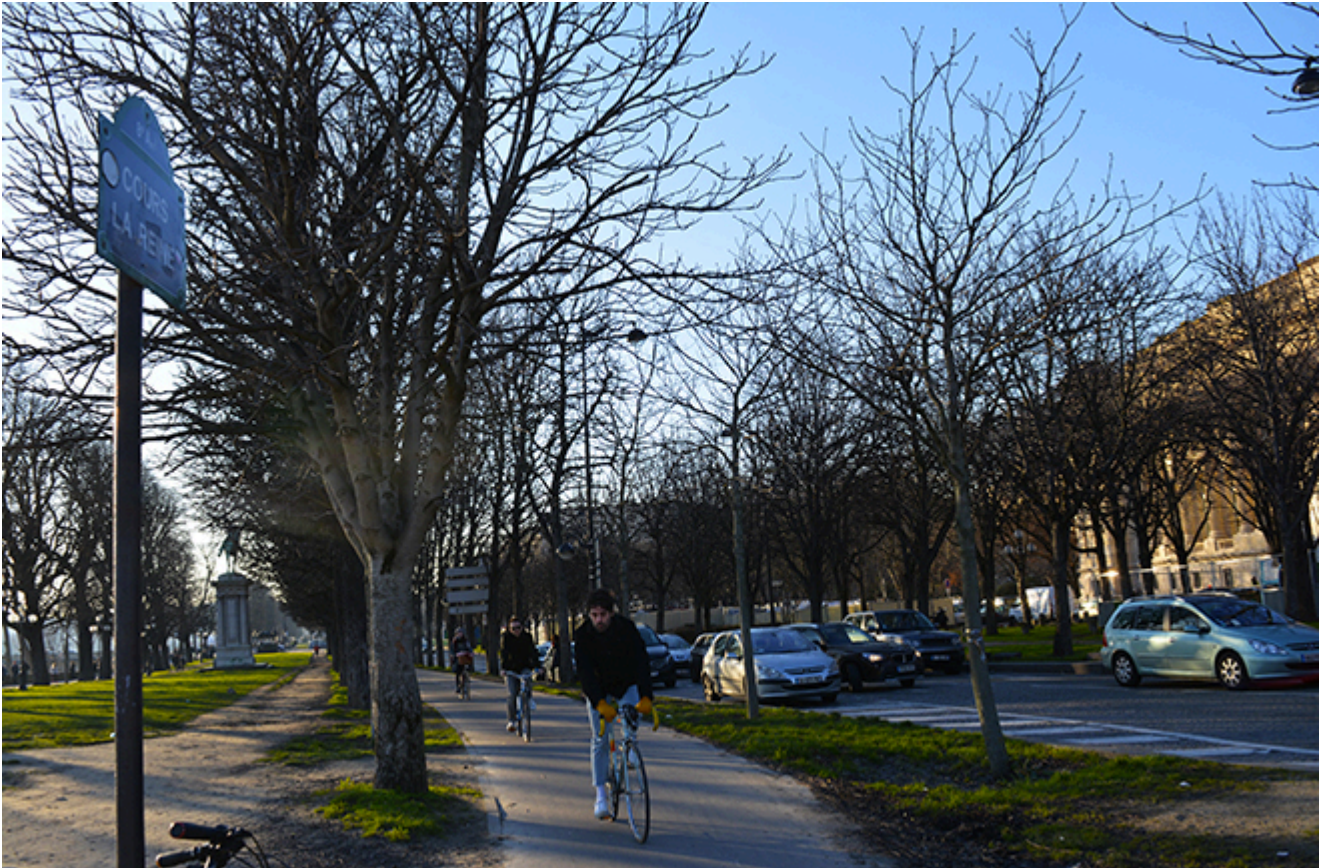
Foto 1. La promenade

Il Cours, compreso tra i ponti di Concorde e Invalides, vicino agli Champs Elysees e al Grand Palais è un indirizzo di prestigio e di glorificazione per i personaggi illustri. Sono installate qui, infatti, grandi statue che glorificano: Simon Bolivar, il Marchese de La Fayette e Alberto I del Belgio.