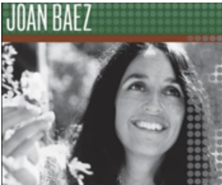
Foto 2. La canzone di Joan Baez su youtube

due anarchici italiani, il significato dell'intitolazione a loro nome di una strada del Comune di Napoli. La diversità di origine, di lingua, di cultura non siano mai pretesti di esclusione e persecuzione e ancor meno lo siano le idee di giustizia pace e libertà che ancora oggi evocano i nomi di Nick e Bart. La ballata celeberrima a loro diretta da una delle militanti per i diritti civili della nostra epoca, la cantautrice Joan Baez, che ha marciato per un mondo migliore senza barriere e segregazioni, contro le guerre, è la dedica migliore che si possa loro porgere: "Onore a voi Nicola e Bart, riposiate in pace qui nei nostri cuori, il momento estremo e finale è vostro, questo sacrificio doloroso è il vostro trionfo".