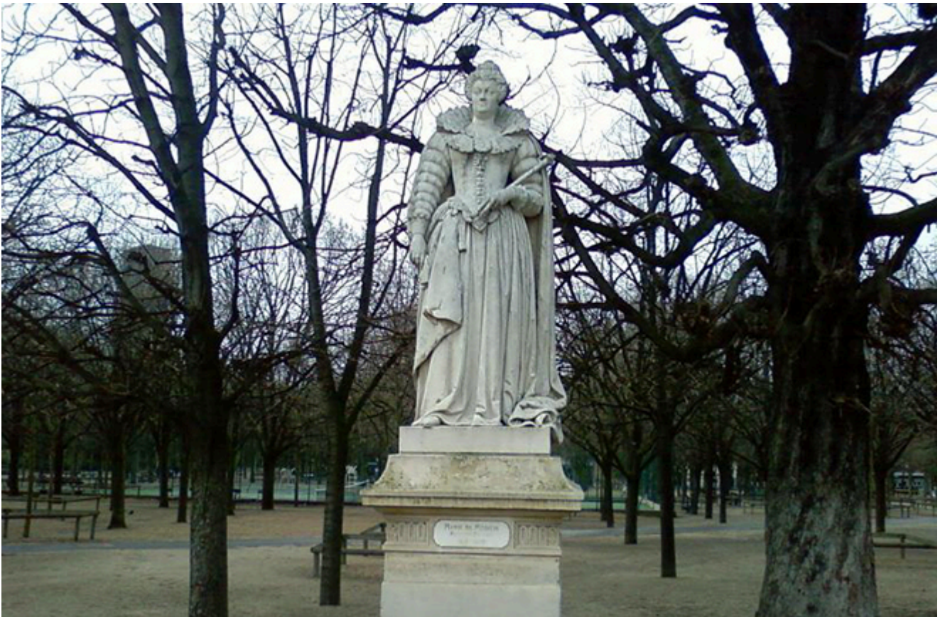
Foto 5. Statua di Maria de Medici ai Giardini del Lussemburgo