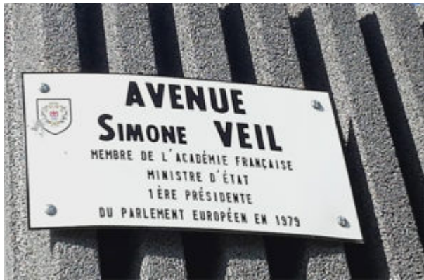
Fig. 5. Intitolazione a Nizza