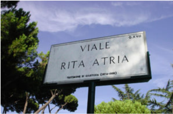
Foto 2. Intitolazione a Roma.

figlia. Per 20 anni la sua tomba è rimasta in stato di abbandono.