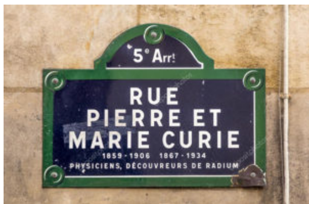
Fig. 2. Intitolazione a Parigi

Del resto, una rassicurante subordinazione di genere continua a trapelare in altri contesti. Marie è la prima persona al mondo ad aver ricevuto ben due Nobel, è la prima donna ad aver avuto un Nobel ed è la sola francese ad averlo ottenuto due volte, eppure, la strada del quinto arrondissement che porta il suo cognome acquisito la vede in posizione secondaria, contro ogni giustificazione alfabetica: Pierre et Marie Curie. E non solo. Sono bastati tre anni dalla morte di Pierre perché la città gli dedicasse una via, ma ne sono serviti trentatré dal decesso di Marie per far aggiungere il suo nome a quella stessa strada.