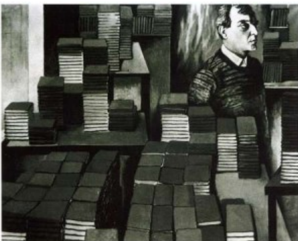
Renato Guttuso - Goffredo Parisè visita a Pechino la fabbrica dei libretti rossi, 1970

Presentazione del primo sito web prodotto dalla neonata cooperativa sociale ZEROBARRIERE: un magazine online con specifiche di navigazione pensate per le disabilità visive e motorie.