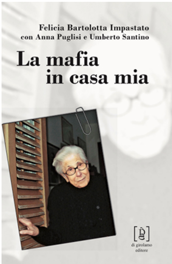
Foto 4. Copertina del libro