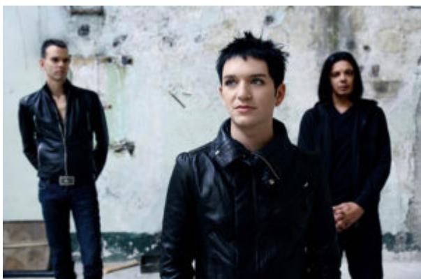
FOTO. I Placebo

Sebbene della line-up attuale sia rimasto tra i membri fondatori il solo Ralf Hütter, un loro live è un'esperienza unica, che nessun altro gruppo può replicare, con una scaletta che ripropone tutti i grandi classici della formazione tedesca.