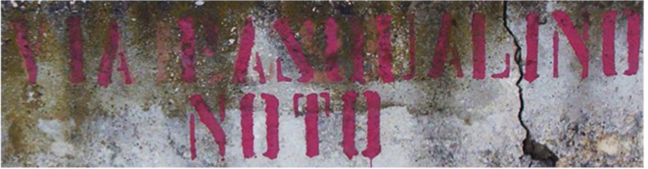
Foto 2. Palermo. Intitolazione a Lia Pasqualino Noto.