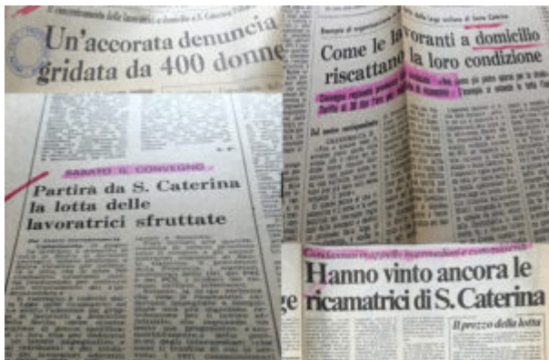
Foto 3. Dai giornali dell'epoca