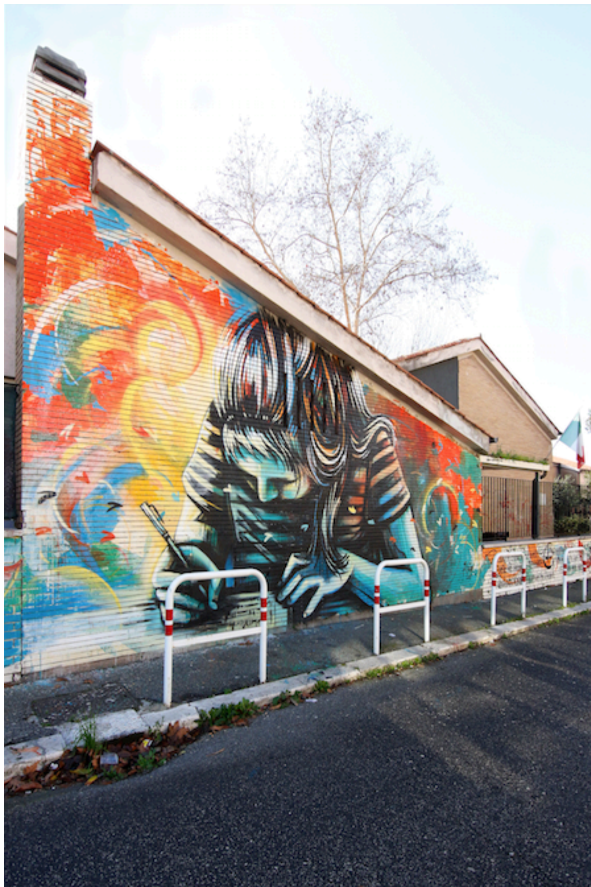
FOT01 LA SCUOLA E IL MURALE

È la rappresentazione della bambina a cui viene dedicata la