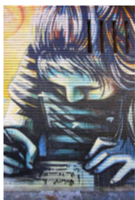
Roma, Casal Bernocchi, 2017

Illustrazioni tratte da “Sole e mare”, volume edito da Matilda Editrice