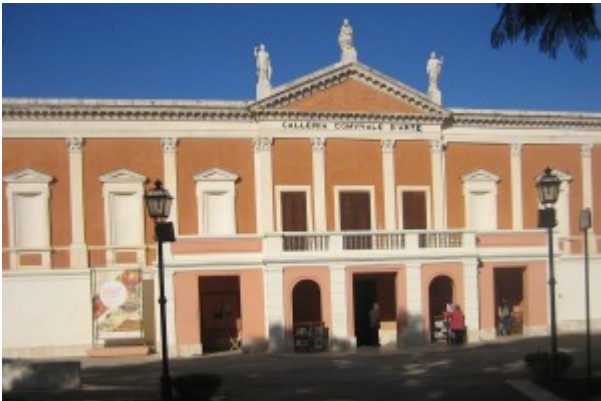
FOTO 5. GALLERIA COMUNALE D'ARTE