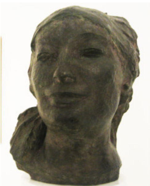
FOTO 6. TESTA DI CONTADINA