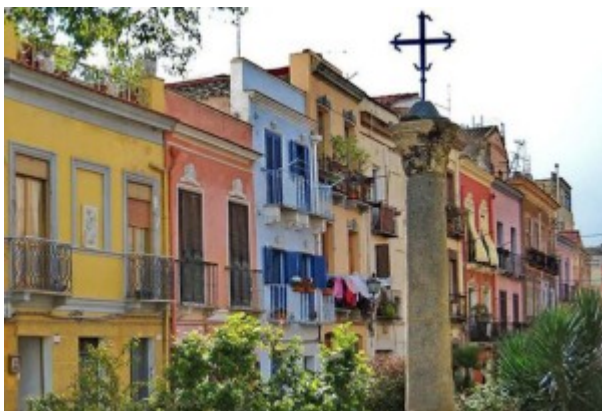
FOTO 2. VILLANOVA VECCHIA

La parte più antica di Villanova si riconosce dalle sue casette basse e colorate, che nascondono orti e giardini interni, e da ciò che resta delle minuscole botteghe artigianali sopravvissute alla crisi. Le vigne e i frutteti che circondavano l'area fino alla prima metà dello scorso secolo hanno lasciato gradualmente posto dapprima a villini liberty e palazzine discrete, e infine ad alti edifici abitativi e chiassose strade.