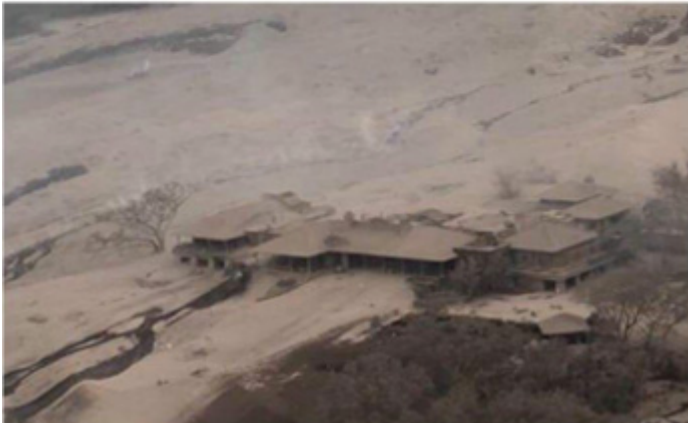
Foto 4. Prima e dopo. La devastazione dei villaggi

Lo stesso giornale accusa il governo di aver causato il ritardo dell'arrivo degli aiuti umanitari internazionali. Vista la sfiducia nella trasparenza delle istituzioni pubbliche locali, diffusa sia in Guatemala che all'estero, la maggior parte delle donazioni viene consegnata direttamente sul posto senza passare per la CONRED.