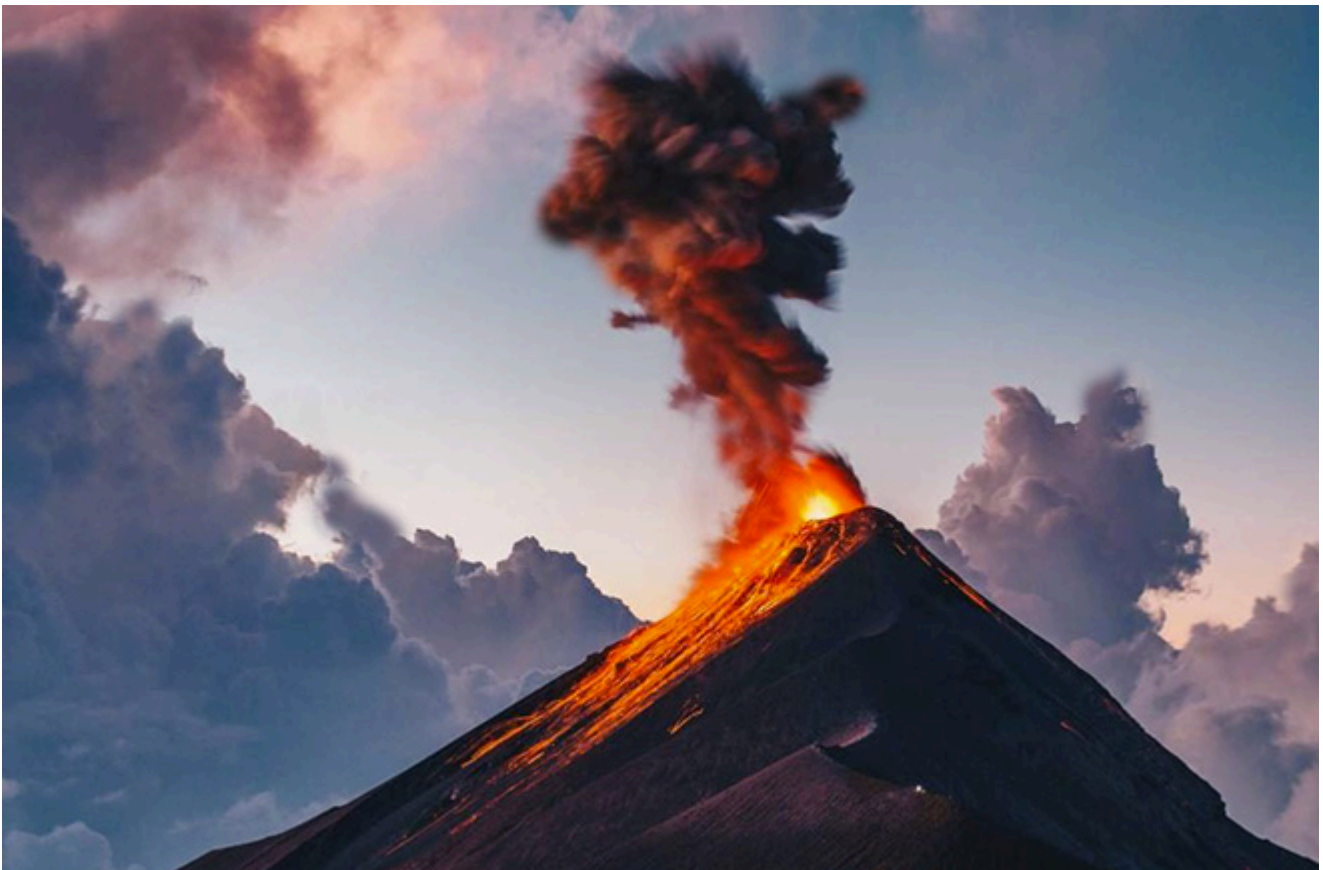
Foto 1. Il vulcano in eruzione

Non è ancora finita la conta degli ingenti danni e delle centinaia di vittime causate dall'eruzione vulcanica che il 3 giugno ha devastato il territorio guatemalteco e la sua popolazione.