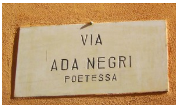
FOTO 10. ADA NEGRI

La passeggiata si conclude con un'altra dedica letteraria che compare nella seconda traversa destra di via Deledda.