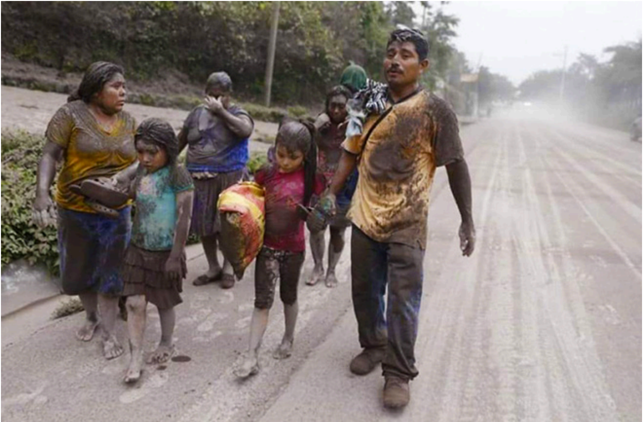
Foto 2. Famiglia in fuga

Eventi come un'eruzione di questo genere sono calamità naturali, non causate dall'attività umana. Eppure, come si è visto varie volte anche in Italia, spesso i danni naturali sono aggravati dalla irresponsabilità degli organi addetti alla prevenzione e al soccorso.