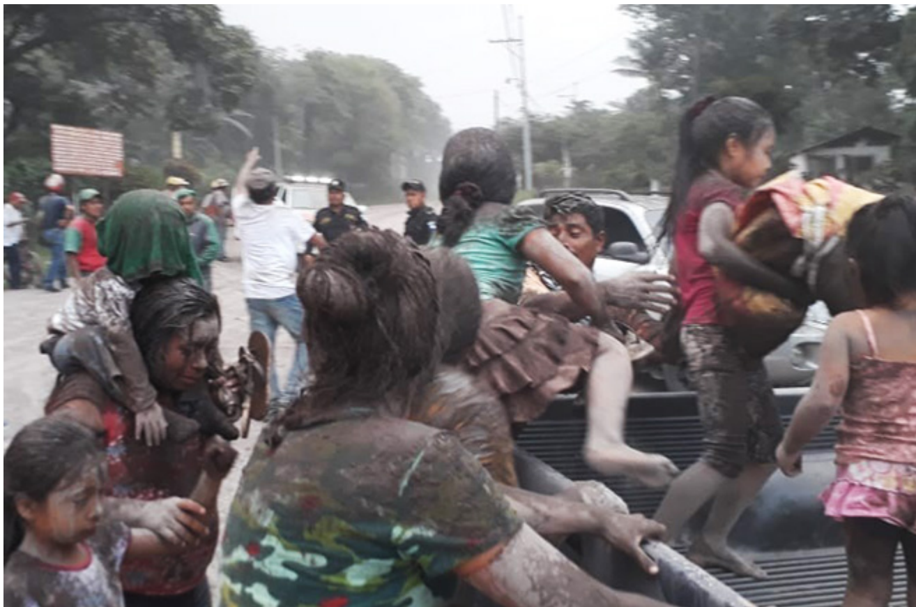
Foto 3. Evacuazione. Donne e bambini

distante circa 30 chilometri dal cratere da cui l'eruzione è partita. Gli abitanti di San Miguel Los Lotes denunciano che la CONRED non ha dato loro l'ordine di evacuazione se non quando la località era già stata sepolta dalla cenere.