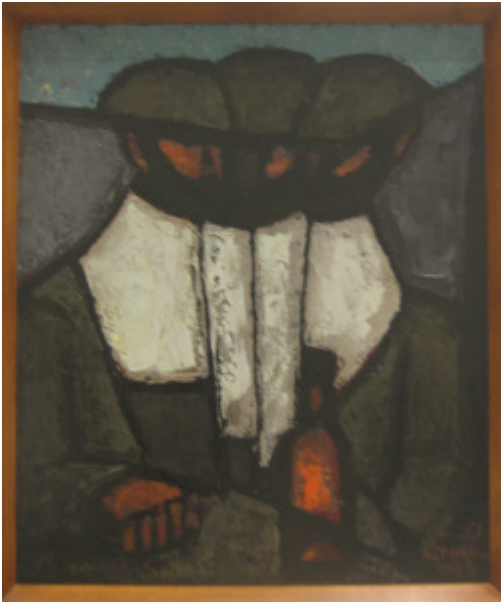
FOTO 7. CORO A TRE VOCI